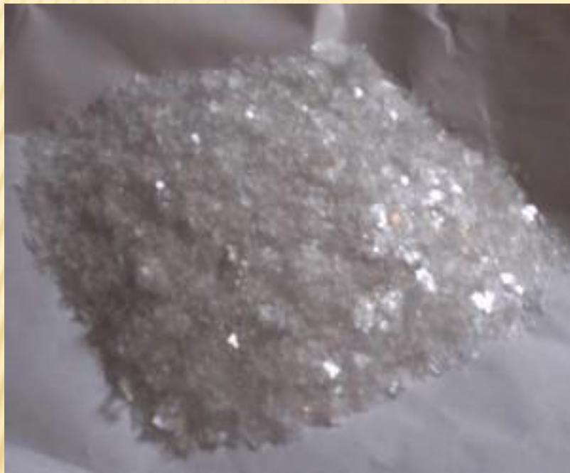
ХЛОРАТ КАЛИЯ (БЕРТОЛЕТОВА СОЛЬ)