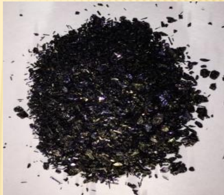
ПЕРМАНГНАТ КАЛИЯ (МАРГАНЦОВКА)