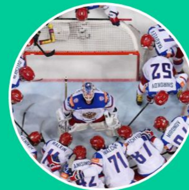
Командные игровые виды спорта

Неолимпийские виды спорта, не признанные Международным олимпийским комитетом, не входящие в основную программу Всемирных игр