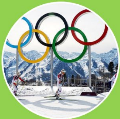
Олимпийские виды спорта