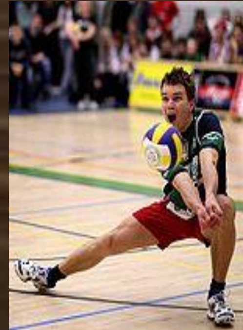
Приём мяча снизу

Обычно принимают мяч игроки, стоящие на задней линии, то есть в 5-й, 6-й, 1-й зонах. Однако принять подачу может любой игрок. Игрокам принимающей команды разрешается сделать три касания и максимум после третьего касания перевести мяч на половину противника. При приёме не допускается никакая задержка мяча при его обработке, хотя принимать мяч можно любой частью тела. Планирующую подачу — могут принимать 2 игрока на задней линии, но для приёма сидевой подачи