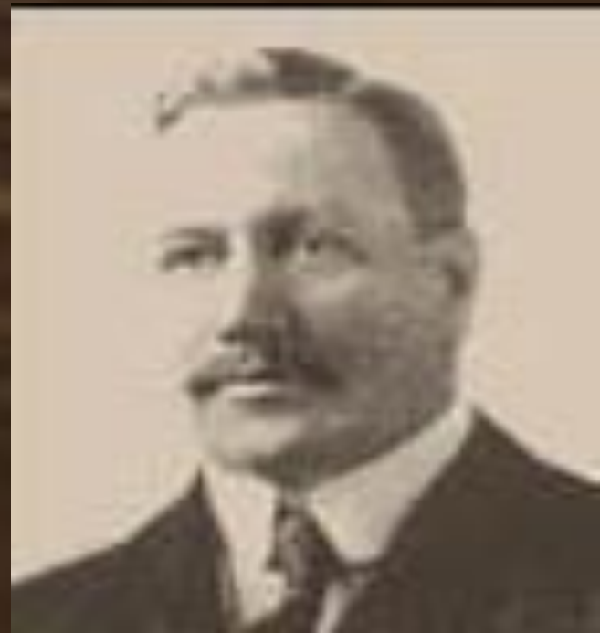
Уильям Дж. Морган