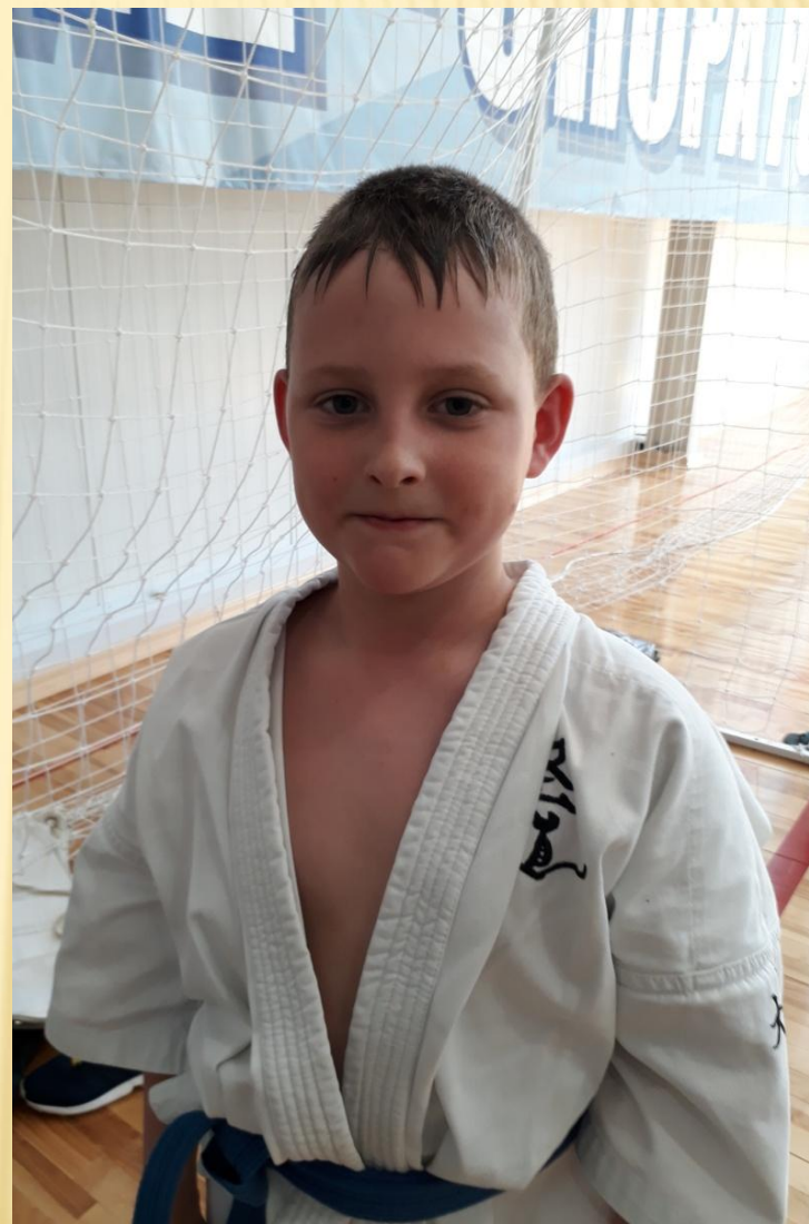
Я после боя