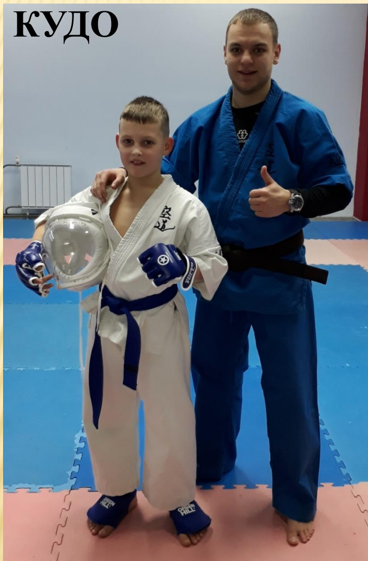
Я и Сэнсэй