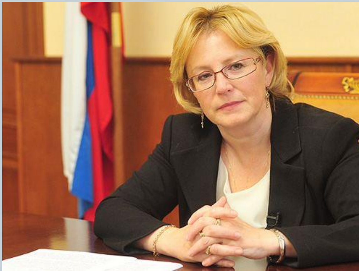
Скворцова Вероника Игоревна Министр здравоохранения РФ