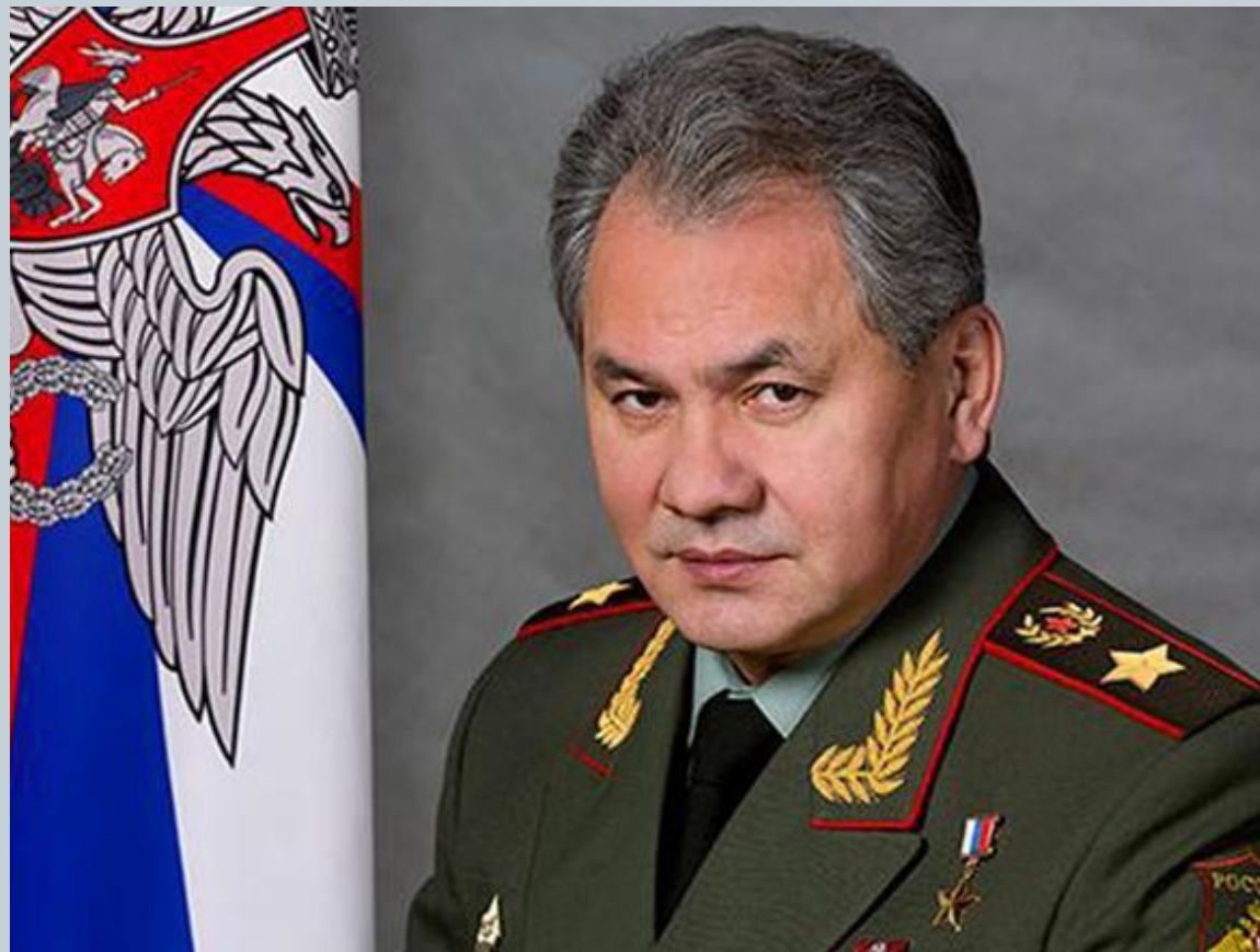
Шойгу Сергей Кужугетович Министр обороны Российской Федерации, генерал армии