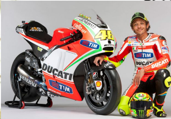
Валентино Росси (Италия)

Символ современного мотоспорта итальянец со звучным прозвищем «Доктор» уже на протяжении 19 лет блистает на небосклоне гоночного спорта. За свою длинную карьеру Росси одержал 111 побед и набрал более 5000 зачетных очков в чемпионате, что больше чем у ближайшего преследователя на две тысячи баллов. Обладатель огромного количества впечатляющих рекордов и титулов. Девятикратный король гоночных трасс чемпион мира, первый мотогонщик который смог одержать победу во всех имеющихся на данный момент уровнях супер класса. И сейчас в довольно солидном возрасте для гонщика не утратил жажды борьбы и побед, продолжая свою неповторимую карьеру.