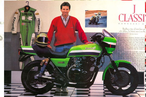
Эдди Лоусон (США)

Карьера Лоусона была не очень долгой, но весьма плодотворной на всевозможные победы и трофеи. Эдди обладатель четырех чемпионских титулов в мотогонках, победитель тридцати одного этапа Гран-при. Американец слишком рано завершил свою гоночную карьеру в возрасте 34 лет, если бы он продолжил свои выступления то, несомненно, мог выиграть еще не один трофей в свой личный музей. Его кредо не только в спорте, но и жизни: только победа второе место не для него.