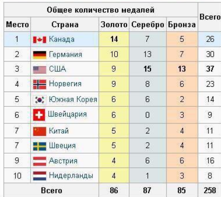
Медальный зачёт на зимних Олимпийских играх 2010