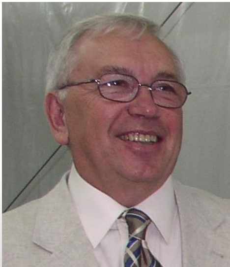
Президент Паралимпийского комитета России Владимир Петрович Лукин

В 1996 году был создан национальный Паралимпийский комитет (НПК) России