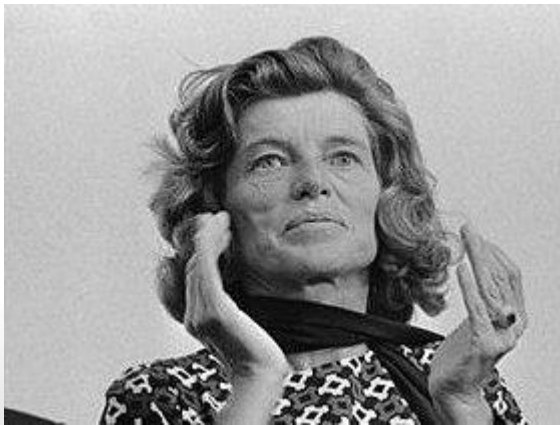
Основатель Международной организации Специальных олимпиад Юнис Кеннеди- Шрайвер

Девиз Специальной Олимпиады: «Позвольте мне победить. Но, если я не смогу, пусть я буду смелым в этой попытке!».