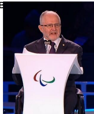
Президент МПК сэр Филипп Крейвен (Великобритания)