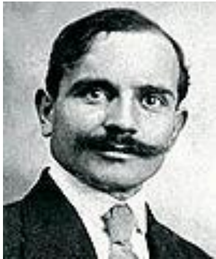
Первый Президент Международного спортивного комитета глухих Эжен Рубен- Алке (Франция)