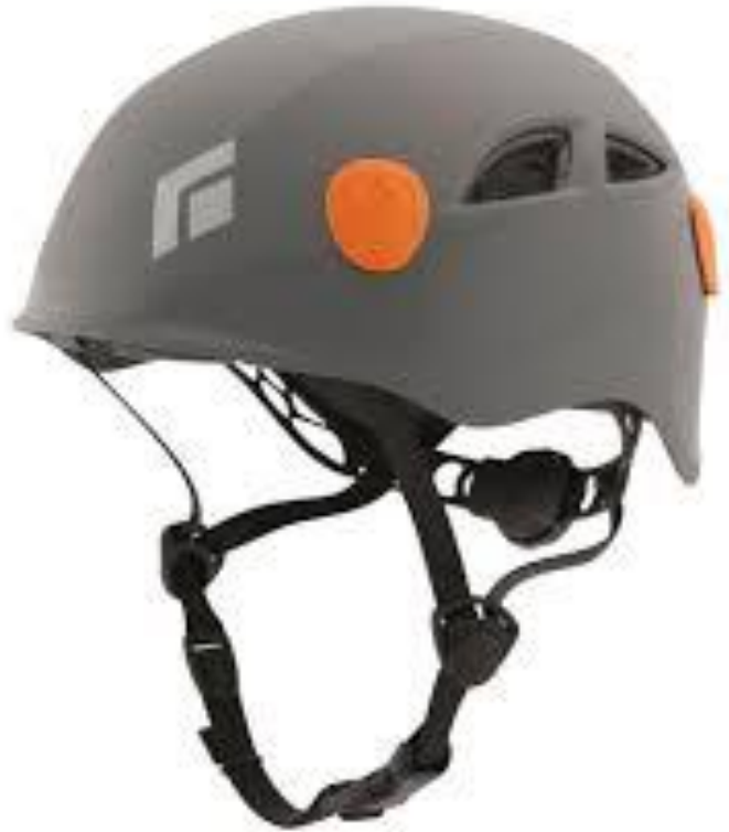
Black Diamond Half Dome 4390 руб.