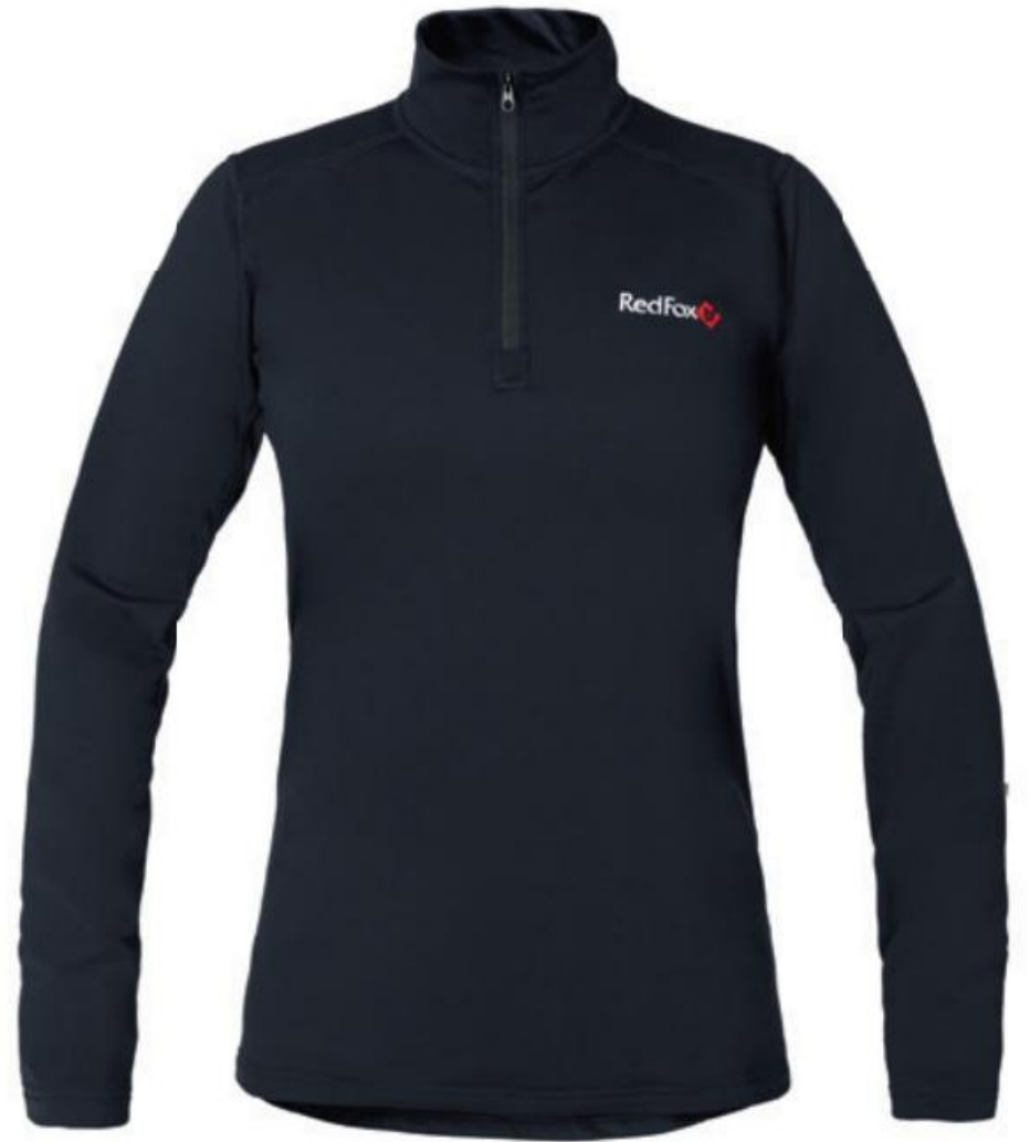
Термобелье Active Mid - 2900