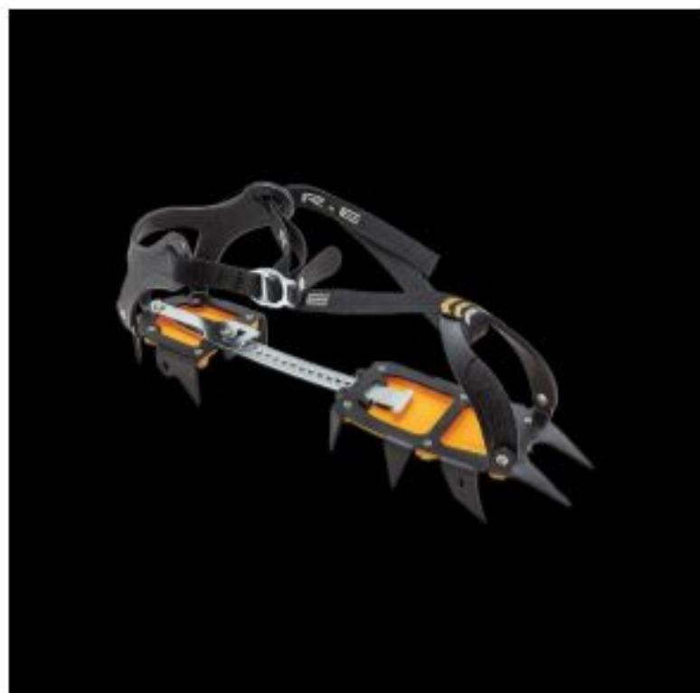
Rock Empire Machki