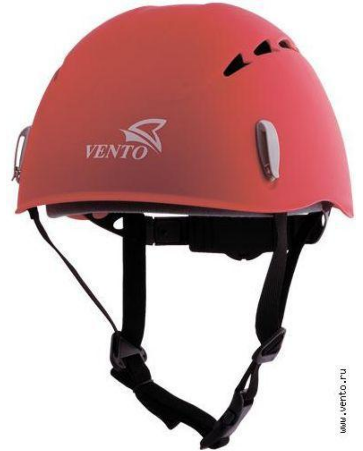
Vento Classic 3490 руб.