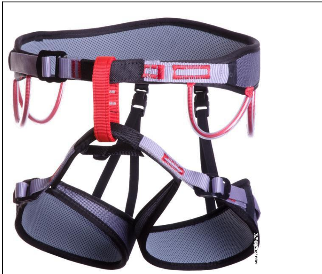
Vento Neon 2990 р