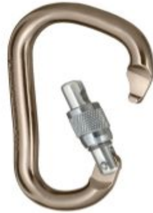
Black Diamond RockLock