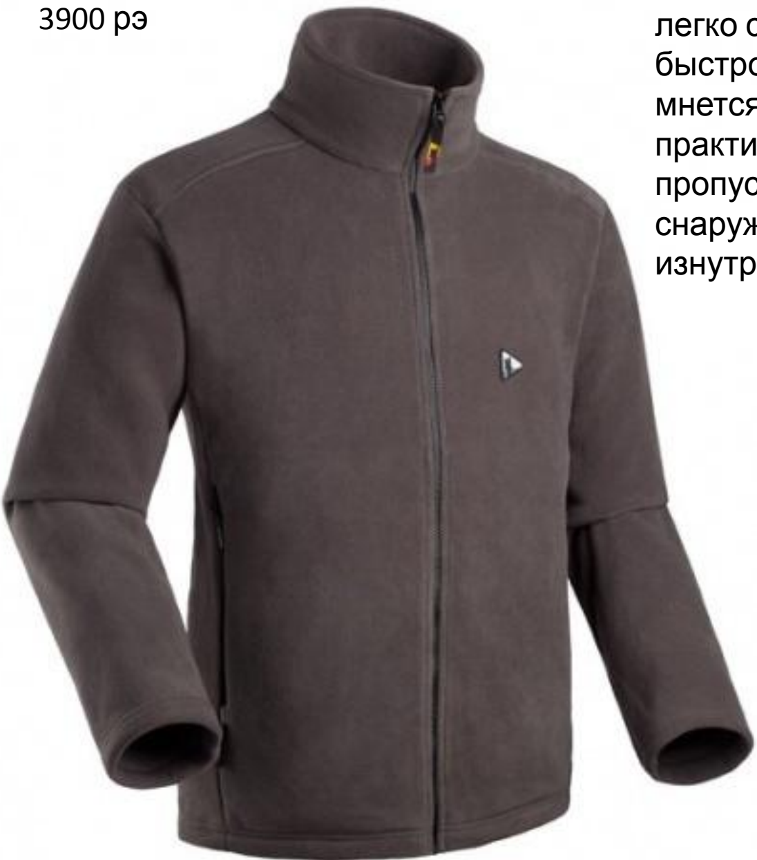
Bask, Polartek classic 200 3900 рэ

легко стирается, быстро сохнет, не мнется, удобен, практичен, не пропускает влагу снаружи, но выводит изнутри.