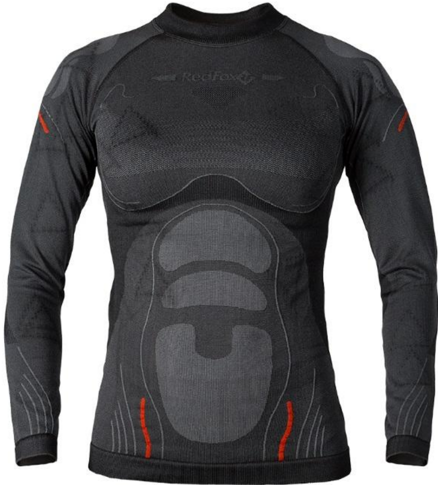
Термобелье Dry Zone – 1750 рэ