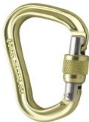
Black Diamond VaporLock