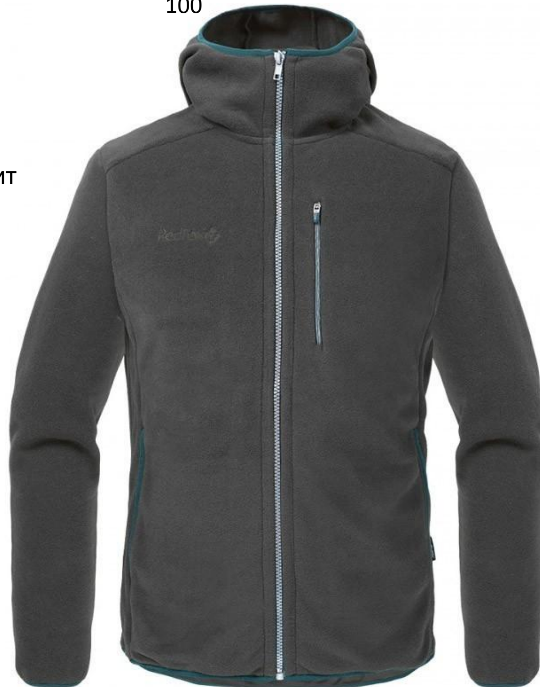
3640 рэ, полартэк 100

легко стирается, быстро сохнет, не мнется, удобен, практичен, не пропускает влагу снаружи, но выводит изнутри.