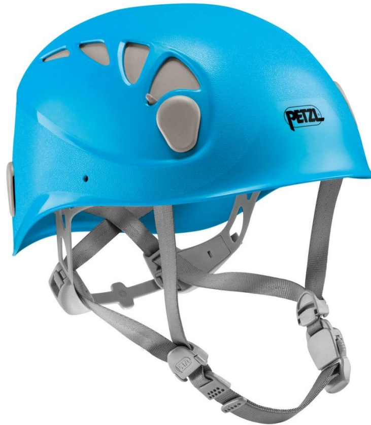
Petzl Elios 4490 руб.