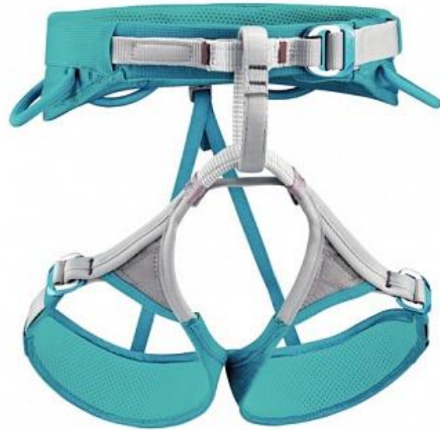
Petzl Luna 5490 p