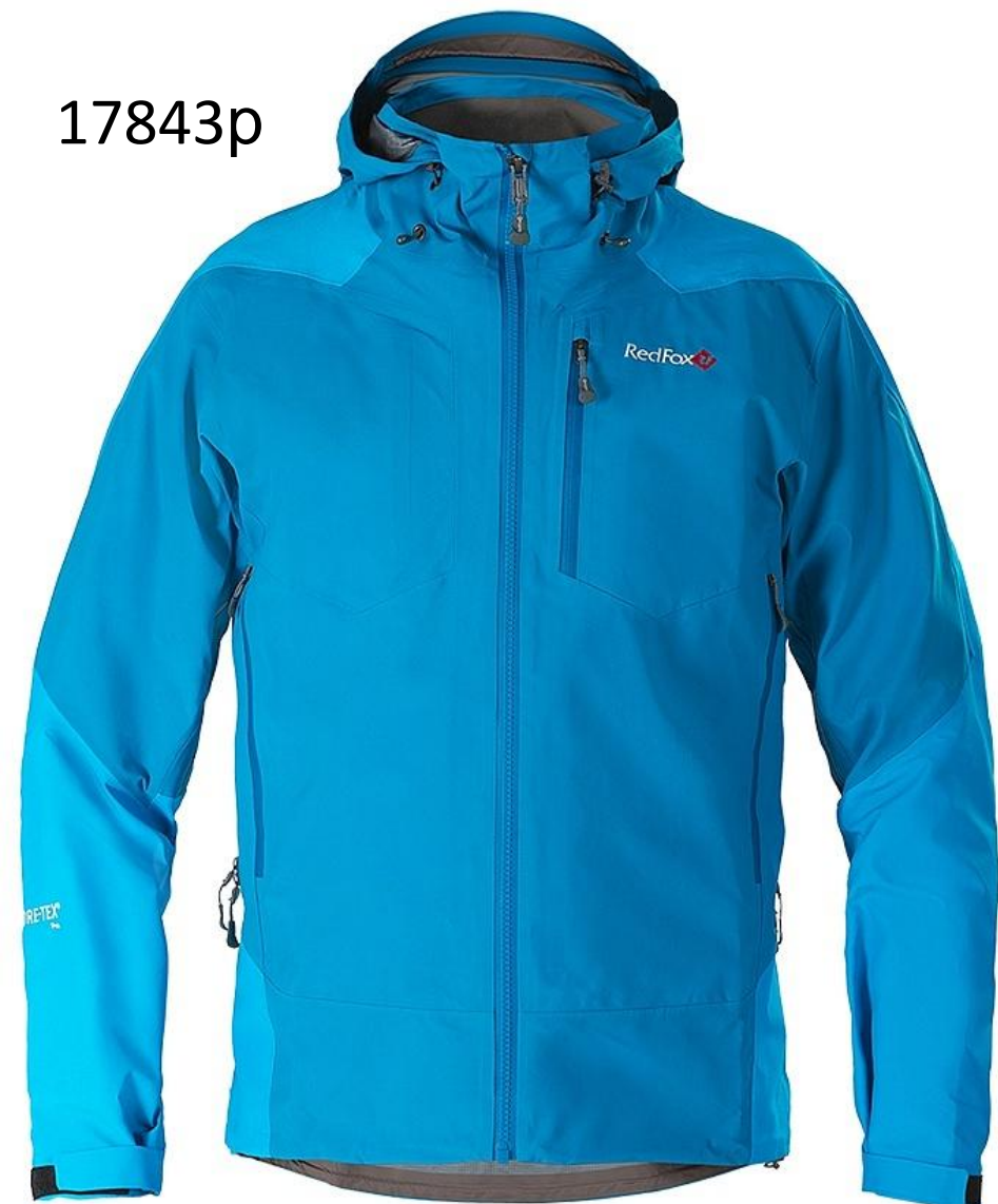
Red Fox Куртка ветрозащитная Long Trek Мужская