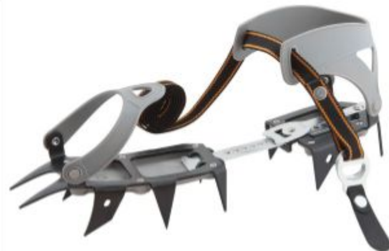
Vento Кошки мягкие