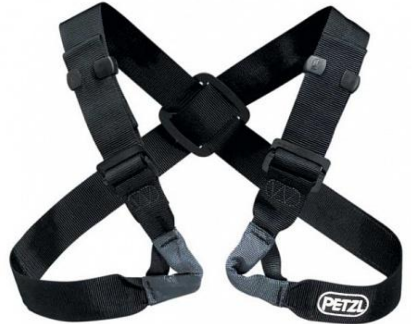
Petzl Voltige 2980 p