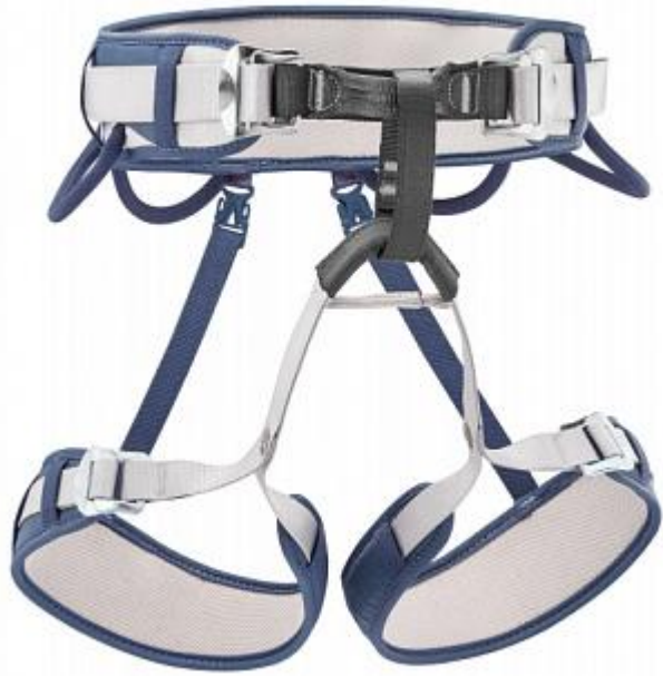
Petzl Corax 4800 p