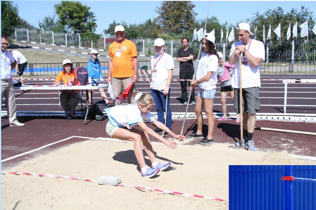
- прыгать в длину с разбега и с места;