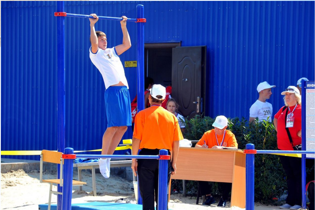
- отжиматься от пола и подтягиваться на турнике;