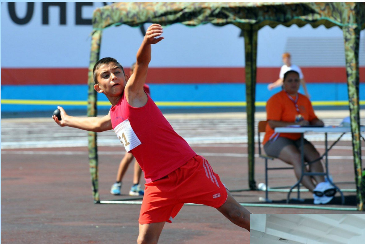
- метать снаряд на точность броска;