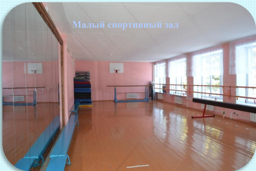
Малый спортивный зал