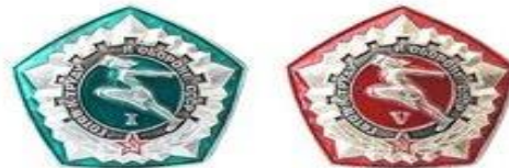
Специальная серия значков ГТО, выпущенная в честь «пяtilетки качества» (1972)