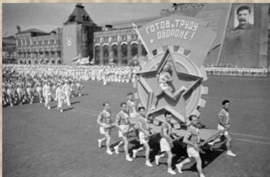
История ГТО в СССР

В 1931 году значкистами ГТО стали 24 тысячи физкультурников, в 1932-м — 465 тысяч и в 1933 году 835 тысяч физкультурников. К весне 1935 года количество значкистов ГТО достигает 1,2 миллионов человек.