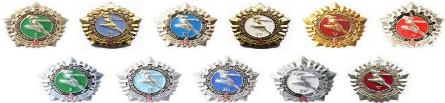
Значки ГТО, 1972 год