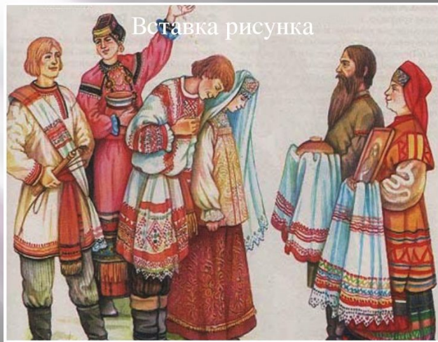
Старинная свадьба на Покров

Покров — последний день сбора плодов и грибов: груздей и рыжиков.