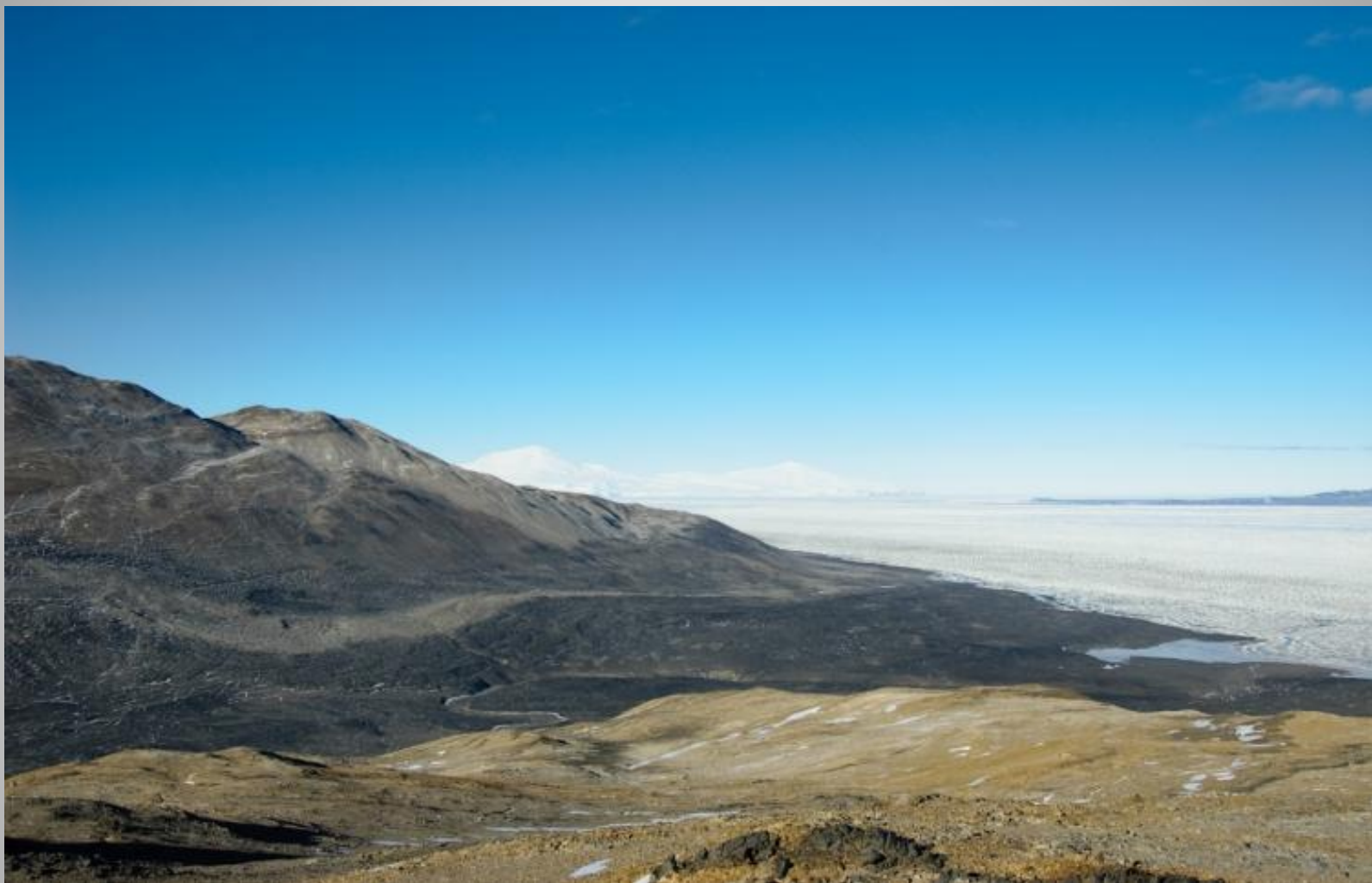
Сухие долины Мак-Мёрдо