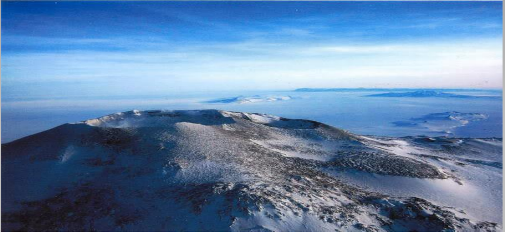
Вулкан Эребус на острове Росса