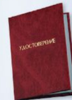
UD4 Размер: 110х80 мм Бумвинил, плотная бумага