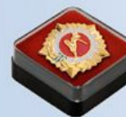
FU98 Внут. размер: 32х32 мм