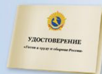
UD6 Размер: 70х100 мм Плотная бумага