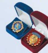
FU125a (бордо) FU125b (синий) Внут. размер: 45х42 мм