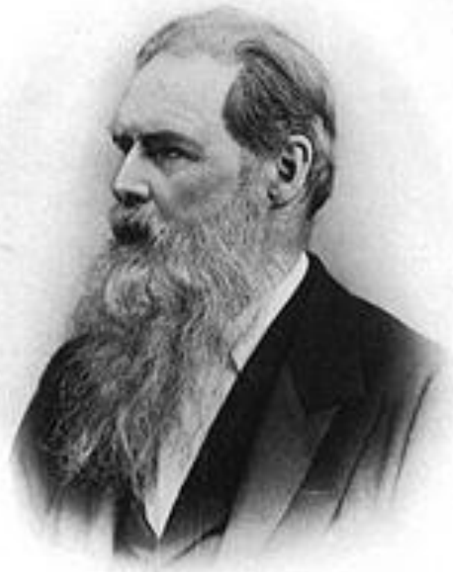
E. B. Tylor - Act. 67