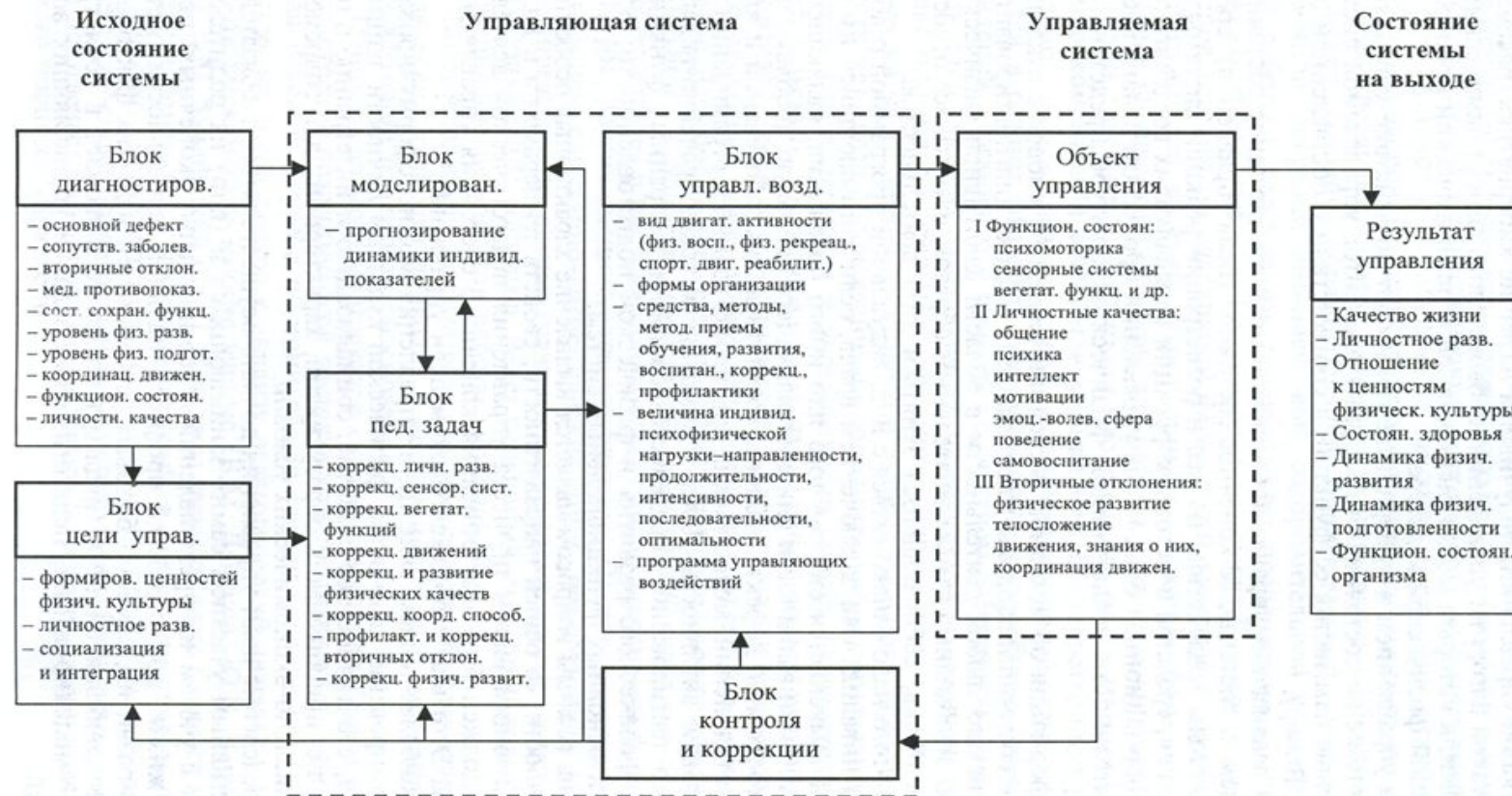
Рис. 1. Информационная блок-схема управления процессом педагогической деятельности в адаптивной физической культуре