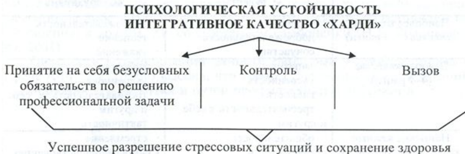
Рис. 2. Интегративное качество «Харди» (по Kobassa, 1979, 1982)