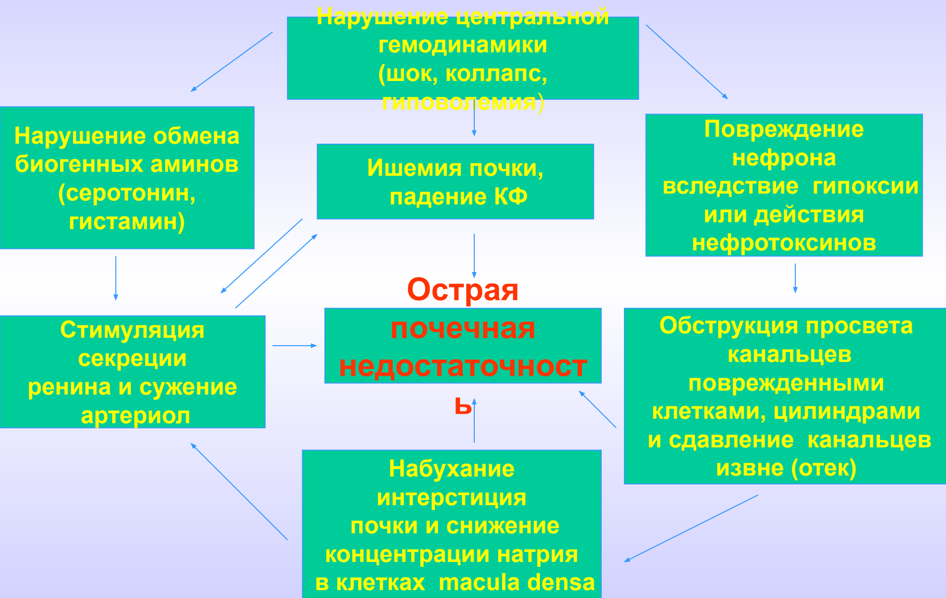
СХЕМА ОСНОВНЫХ МЕХАНИЗМОВ ПАТОГЕНЕЗА ОПН (по Г.П.Кулакову)