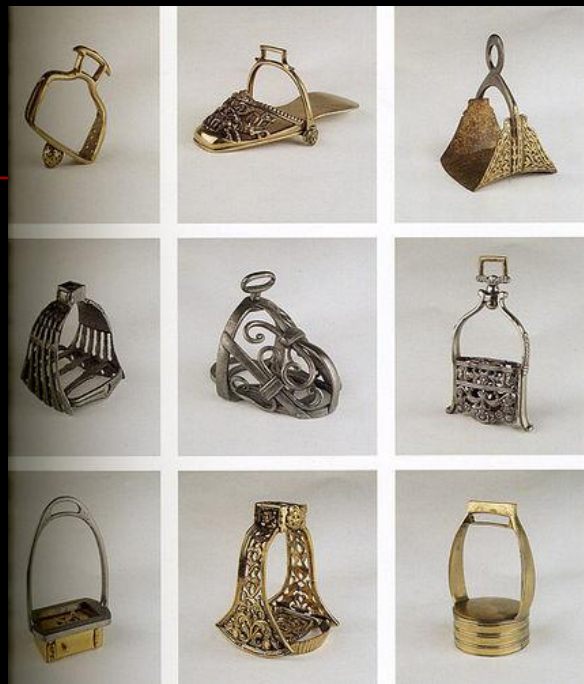
Стремена. Франция. к. XVII н. XVIII веков