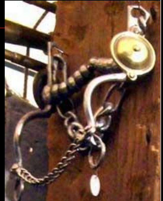
Подвижное грызло. XVII век