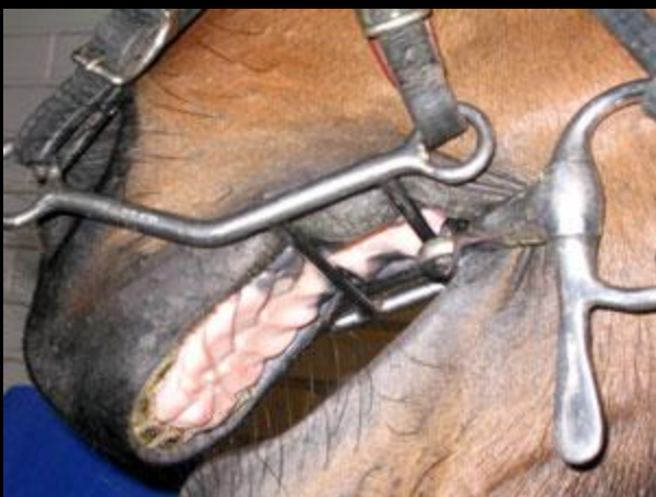
Трензелька для рысаков