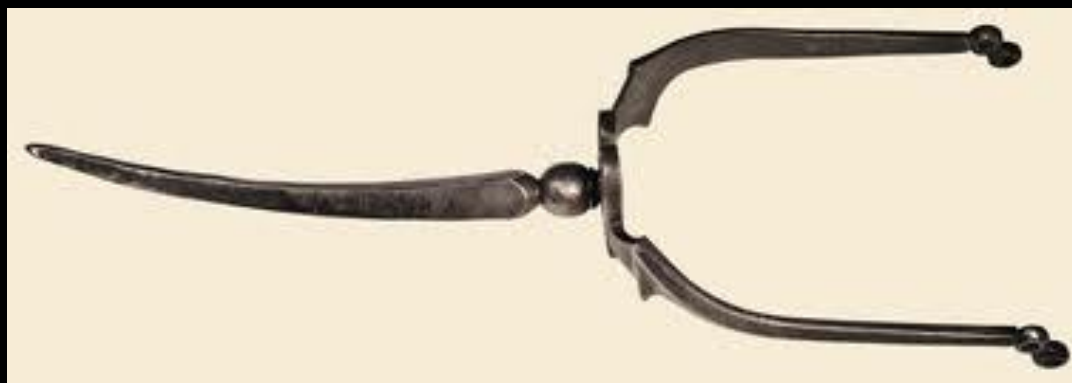
Рыцарская шпора эпохи раннего средневековья