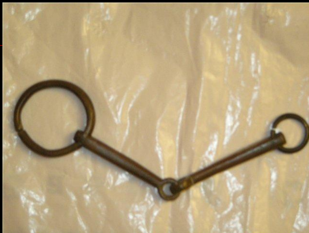
Скифский трензель V века до нашей эры

Лошадиного железа существует сотни разновидностей.