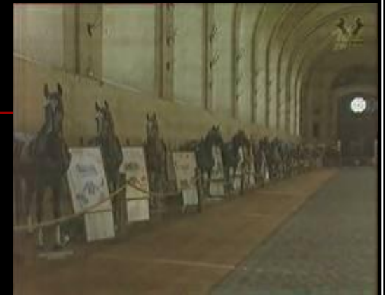
Музей «живых» лошадей