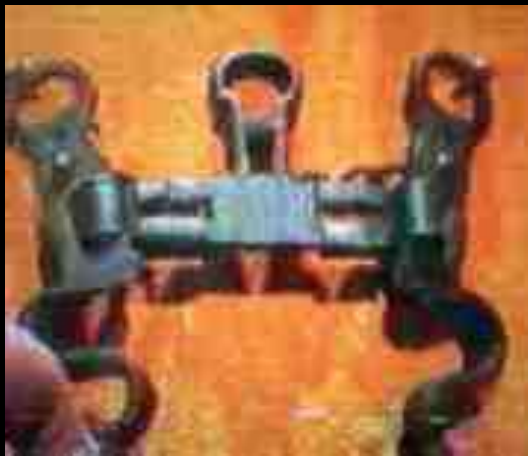
Железо испанских конкистадоров