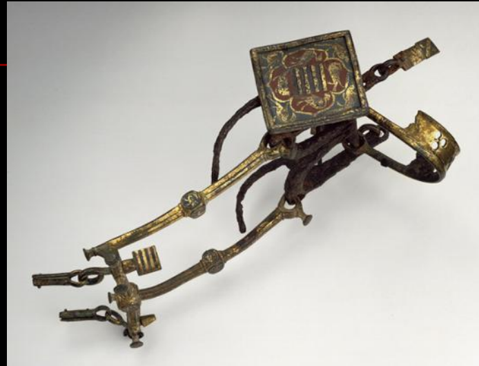
Рыцарский мунштук XIV века