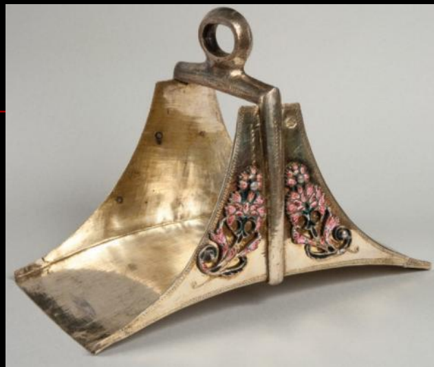
Стремя. Латинские страны. XVII -XVIII века.