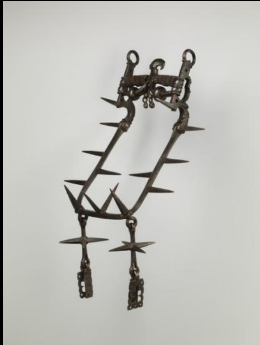
Арабский мунштук XIV века