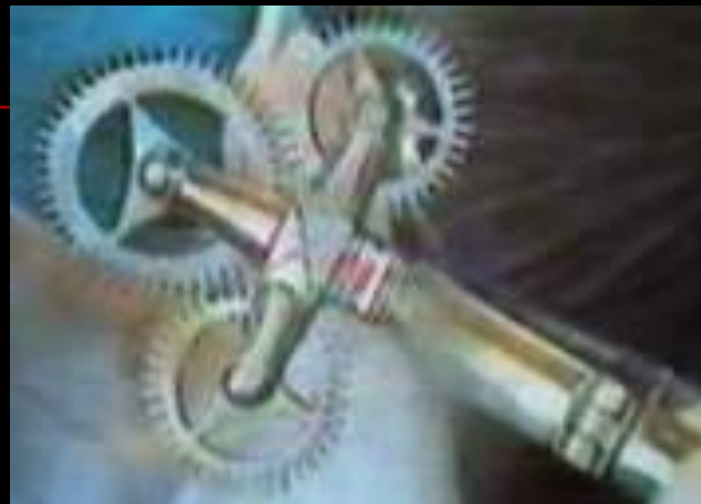
Шпора с тремя колёсиками