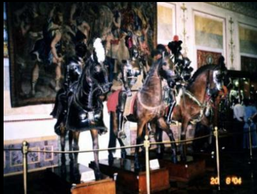
Хранилище Рыцарского зала Эрмитажа