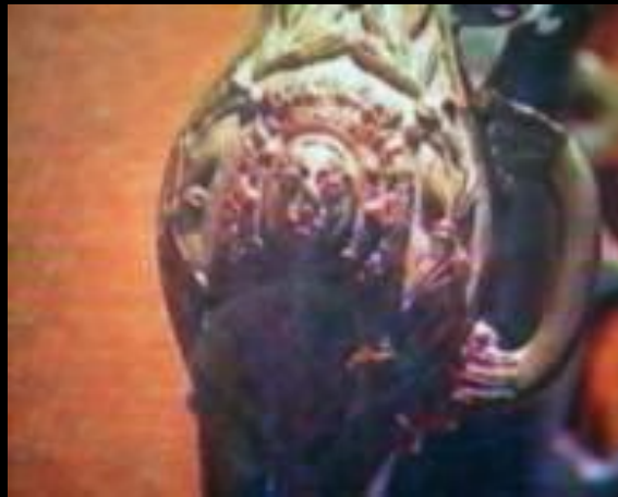
Розетка на мундштуке