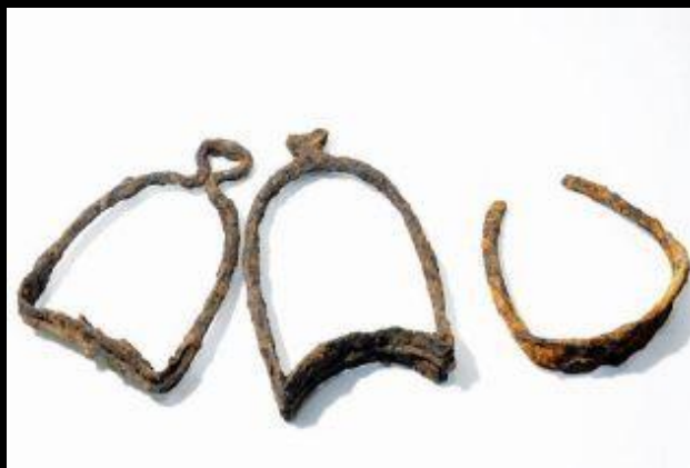
Рыцарские боевые стремяна XIV-XV веков.