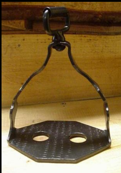
Стремя от Эколь