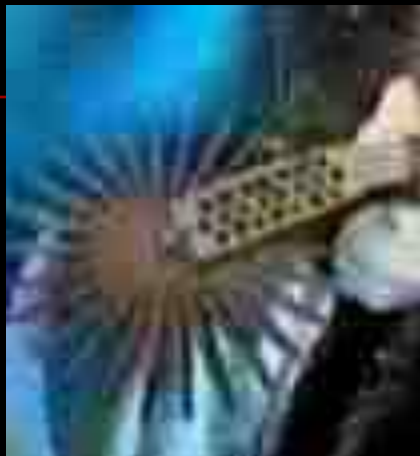
Шпора раннего средневековья