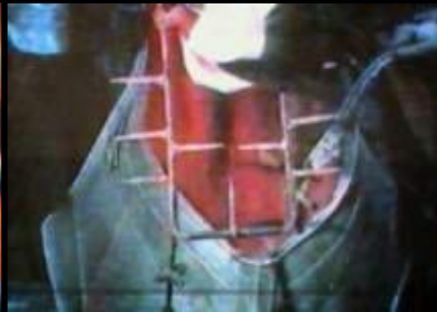
Мундштук с зубьями