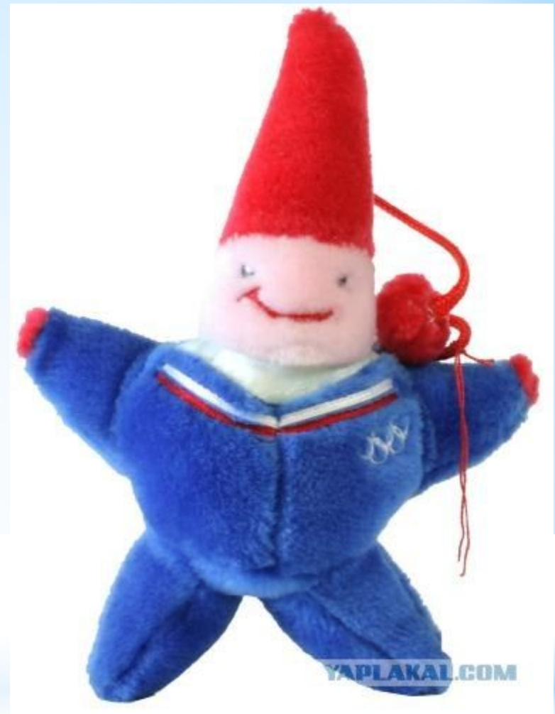
Magique (Магия): Зимние Олимпийские игры, 1992, Альбертвилль, Франция