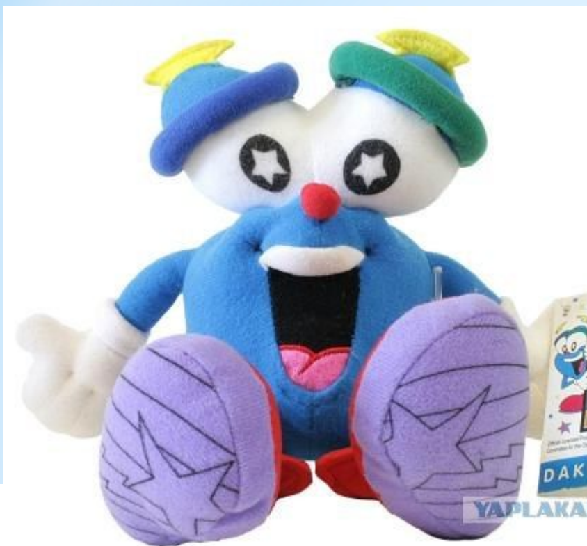
Иззи: Олимпийские Летние игры, в 1996, в Атланте, США