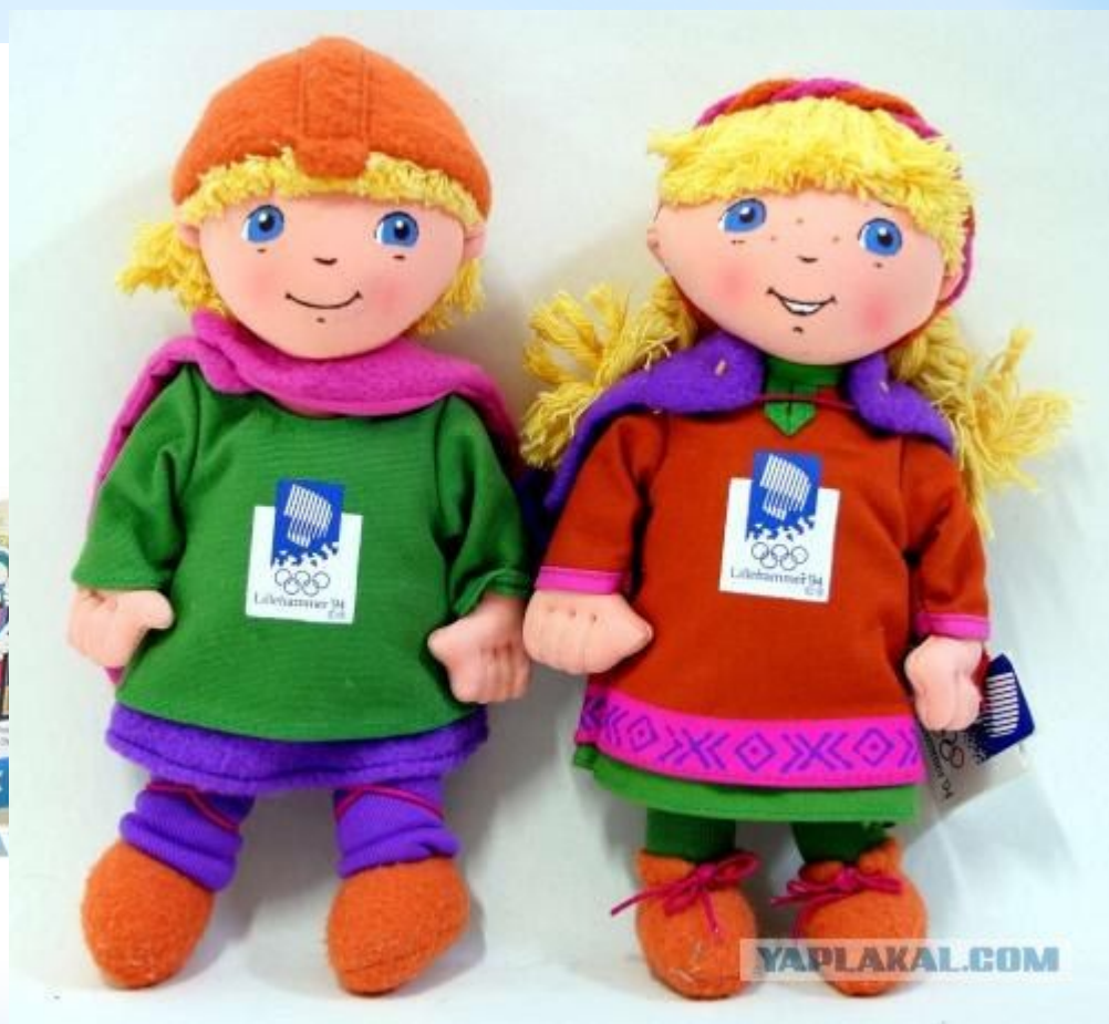
Хокон и Кристин : талисманы Зимних Олимпийских игр 1994 в Лиллехаммере, Норвегия