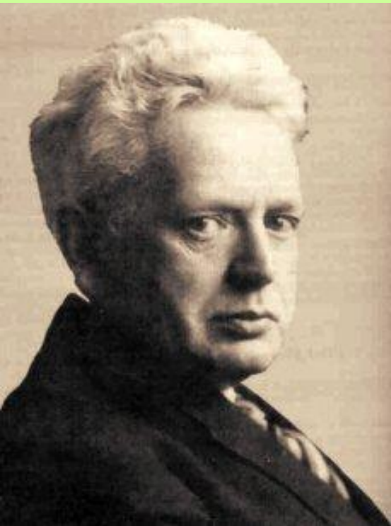
Эрнст Кассирер (1874 – 1945)