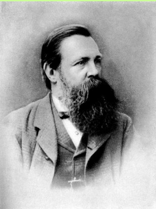
«Человека создал труд» (Ф. Энгельс)