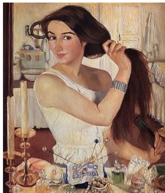
Автопортрет («За туалетом»)

Зинаи́да Евге́ньевна Серебряко́ва — русская художница.