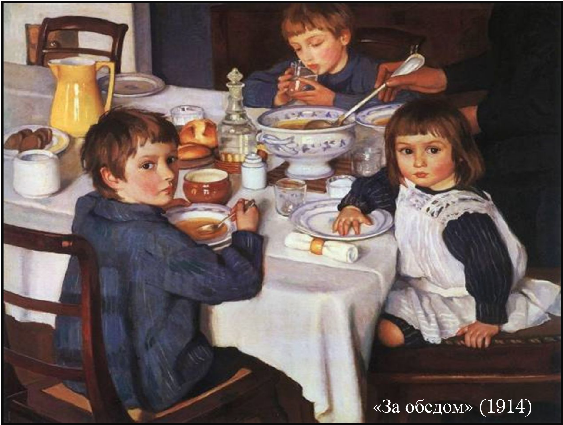
«За обедом» (1914)