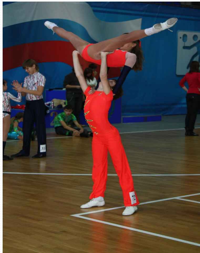
Парных акробатических упражнений