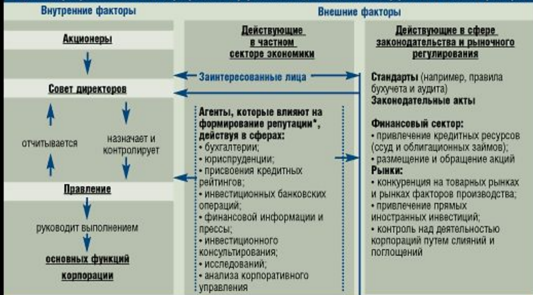
Рис. 2. Формирование системы корпоративного управления под воздействием внутренних и внешних факторов

* Агенты, влияющие на формирование репутации – это организации и специалисты, которые способствуют сглаживанию неравномерного распределения информации между участниками рынка, улучшению надзора за деятельностью компаний и раскрытию случаев неподобающего корпоративного поведения.