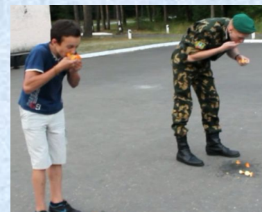
Фото и видео отчет прилагается в электронном виде

А теперь для всех участников и гостей нашего Спортивно-музыкального вечера «Пограничная семья» дискотека.