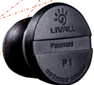
Датчик вращения P1