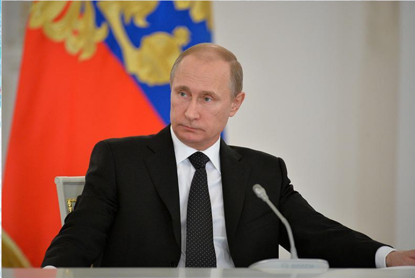
Владимир Владимирович Путин

Дзюдо учит держать себя в руках, чувствовать остроту момента, видеть сильные и слабые стороны соперника, стремиться к наилучшему результату. Согласитесь, политику все эти знания, умения и навыки просто необходимы.