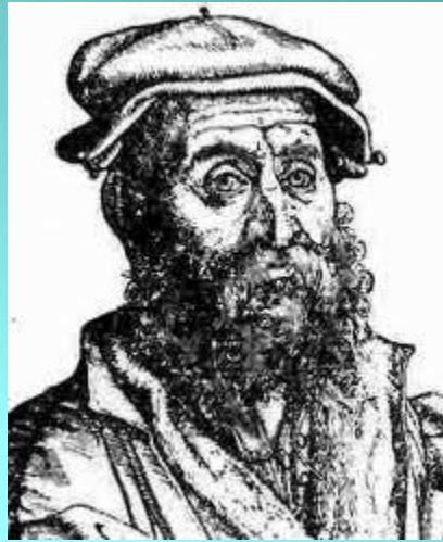
Николо Тарталья [ок.1499-1557]