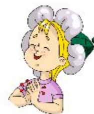
Арслан Миронов Рейтинг: 524