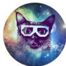
Юра Грязев Рейтинг: 585