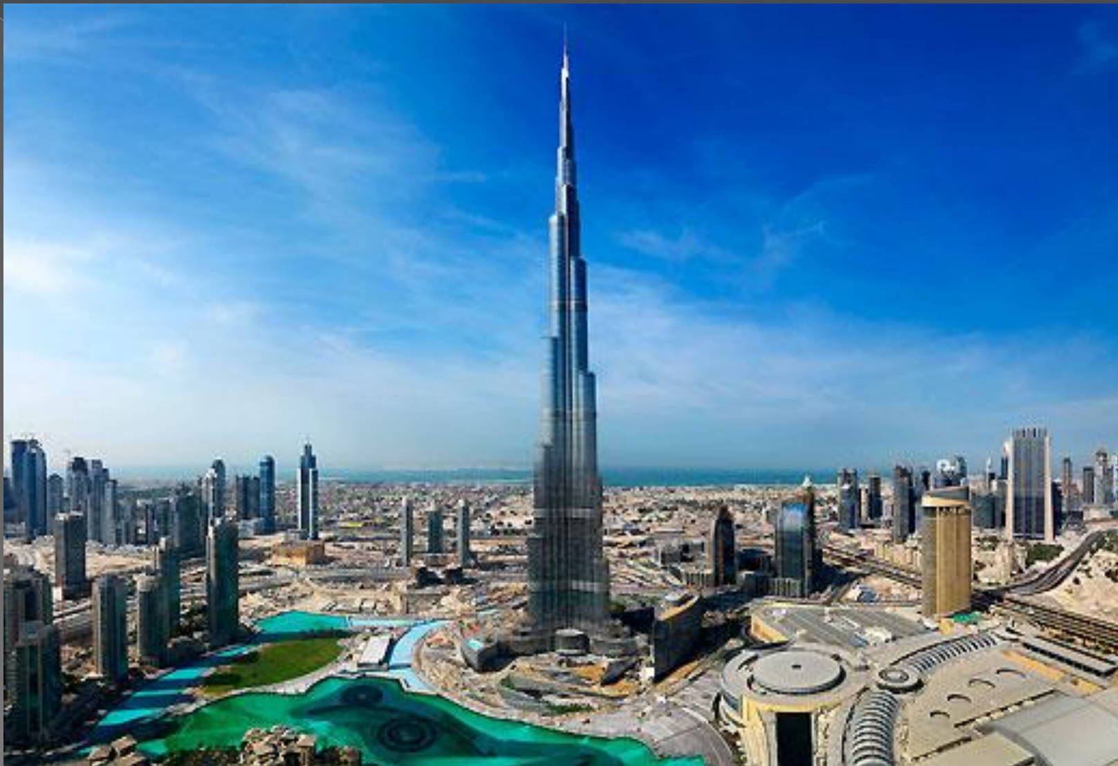
Дубайдағы Бурж Халифа 2016 жыл әлемдегі ең биік ғимарат