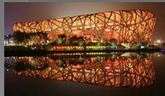
Бейжің ұлттық стадионы