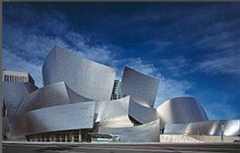
Уолт Дисней концерт залы