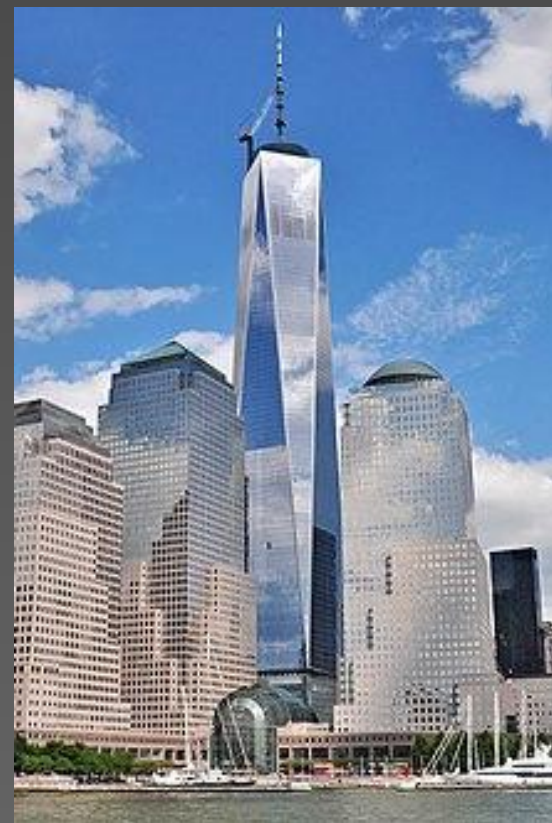
Әлемдік сауда орталығы 1