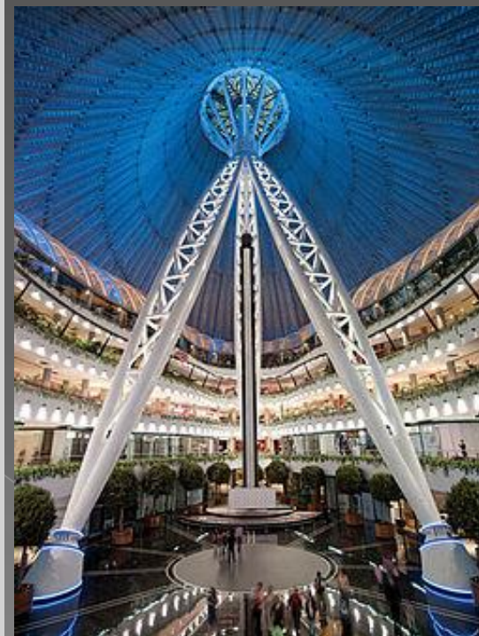
Астанадағы Хан Шатырдың ішкі көрінісі

Постмодернизм түптеп келгенде модернизмге қарсылықтан туындаған. Ол Екінші дүниежүзілік соғыстан кейінгі Батыс Еуропалық ұлы қиялдың быт-шыт болуы себепті өз бойында тұрақтылық, заңдылық, ереже атаулыдан арылған жаңа ағымның пайда болуына түрткі болды.