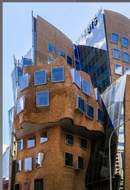
Сидней Технологиялық университетінің бизнес мектебі