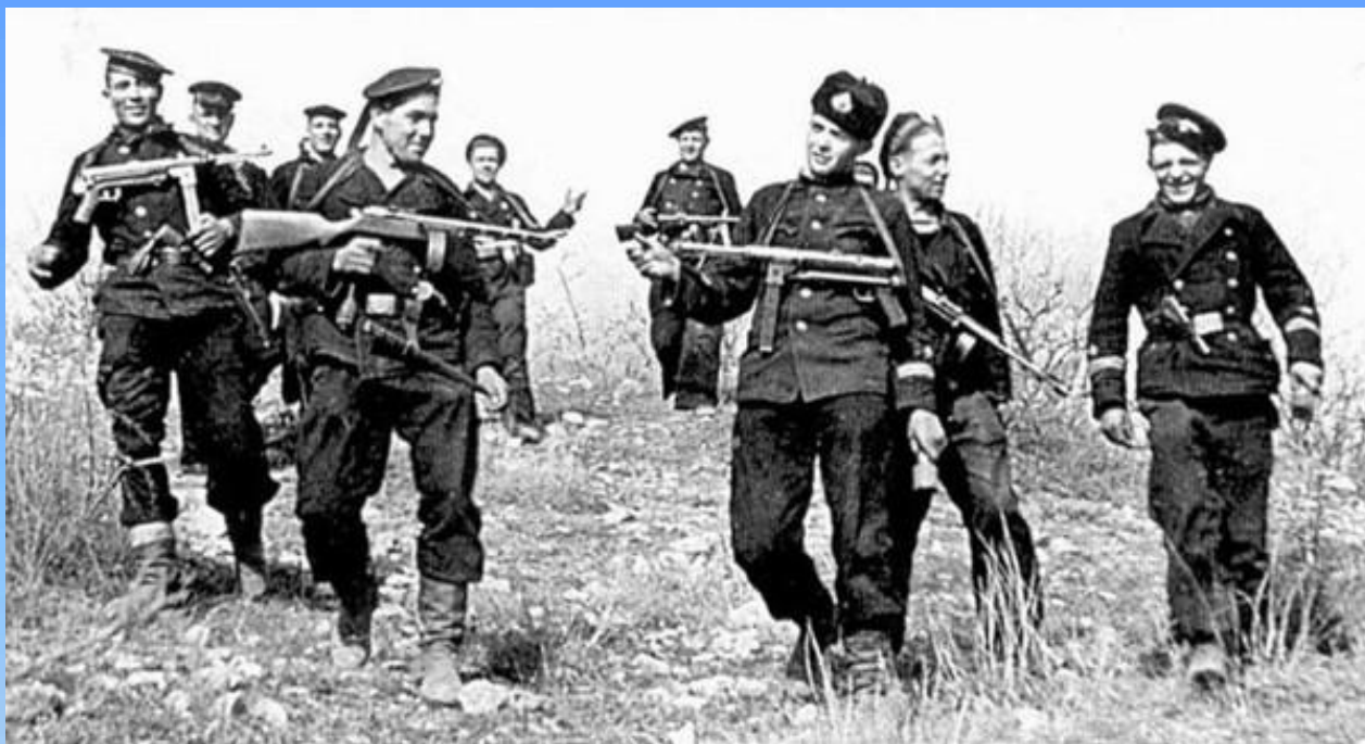
Группа разведчиков 7 Бригады Морской Пехоты Черноморского Флота возвращается с боевого рейда. Окрестности Севастополя, Апрель 1942 года.