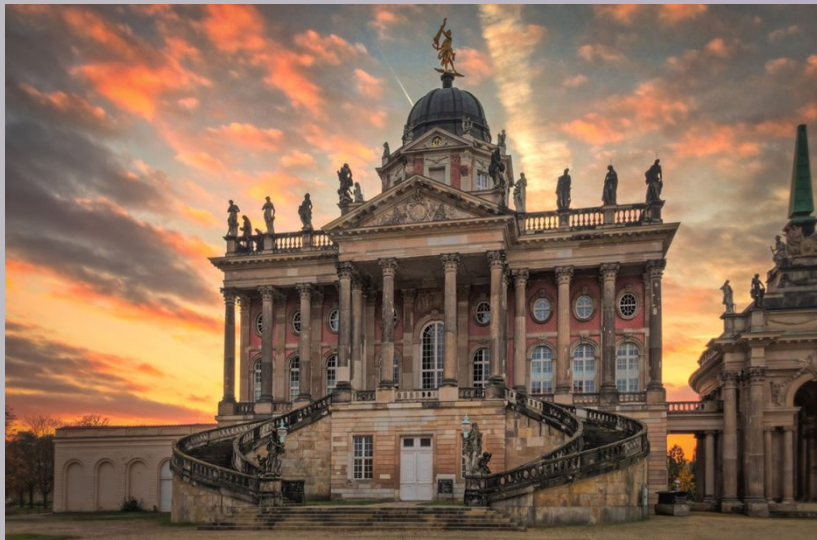
Die Universität Potsdam