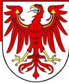
Die Flagge Brandenburgs