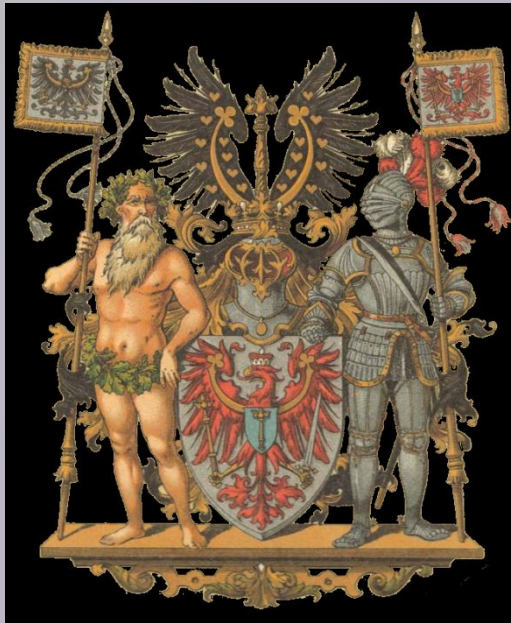
Wappen der preußischen Provinz Brandenburg