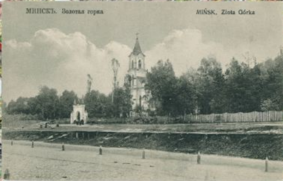
MINSK, Ziota Gorka