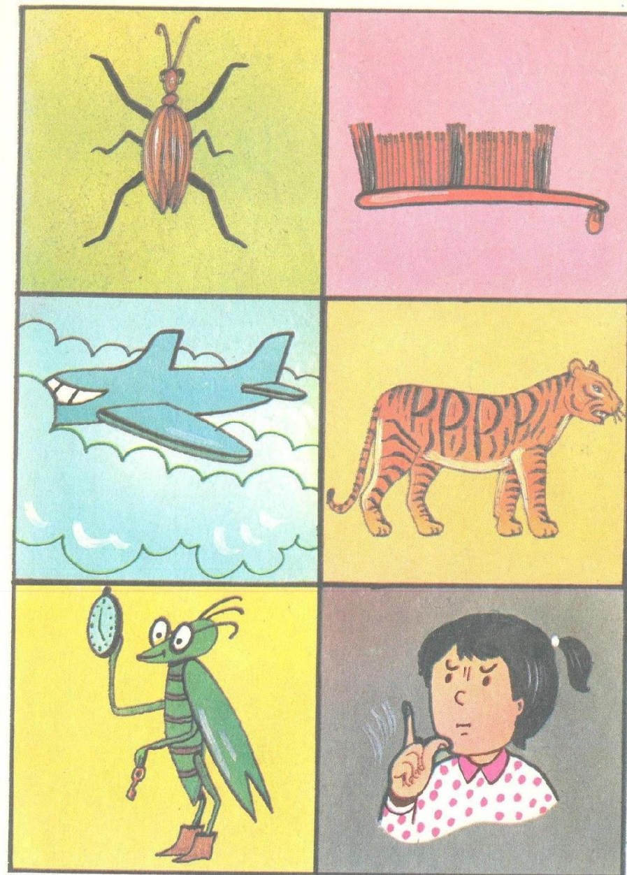
Табл. III. Жук жужжит: «жжж»; возьму щетку и почищу вещи: «щщщ»; самолет летит и гудит: «ллл»; тигр рычит: «ррр»; кузнечик стрекочет: «ч-ч-ч»; девочка просит не шуметь: «ц-ц-ц»