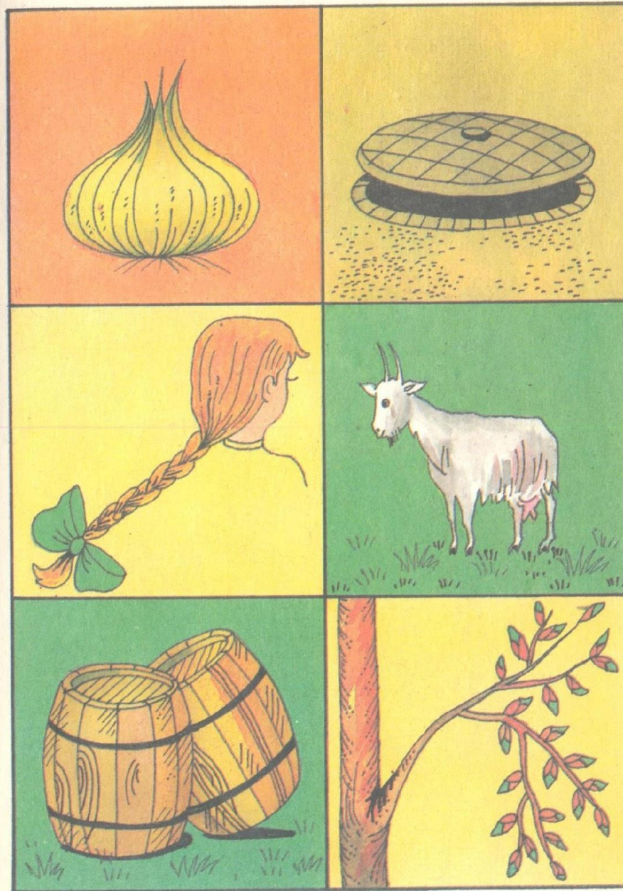
Табл. XI. Лук — люк; коса — коза; бочки — почки