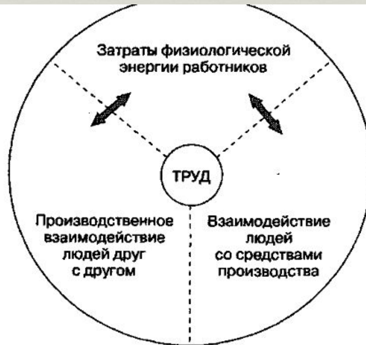
Рис. 2.4. Проявление и структура трудового процесса