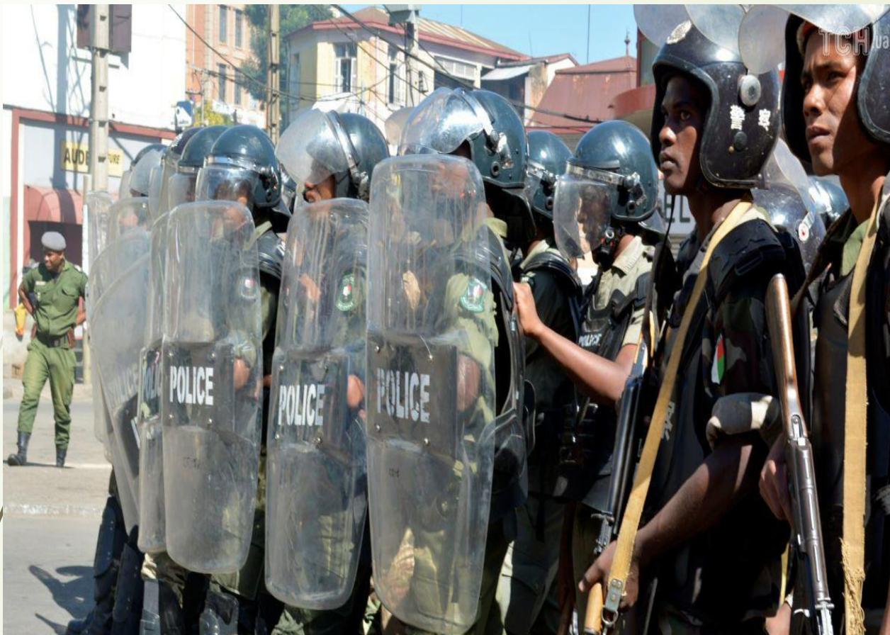
Полицейские на забастовке*

Жизнь на острове всегда была размеренной, местные жители никуда не торопятся, поэтому медленное обслуживание, задержка мероприятия или опоздание на встречу – на Мадагаскаре вполне безобидное происшествие.