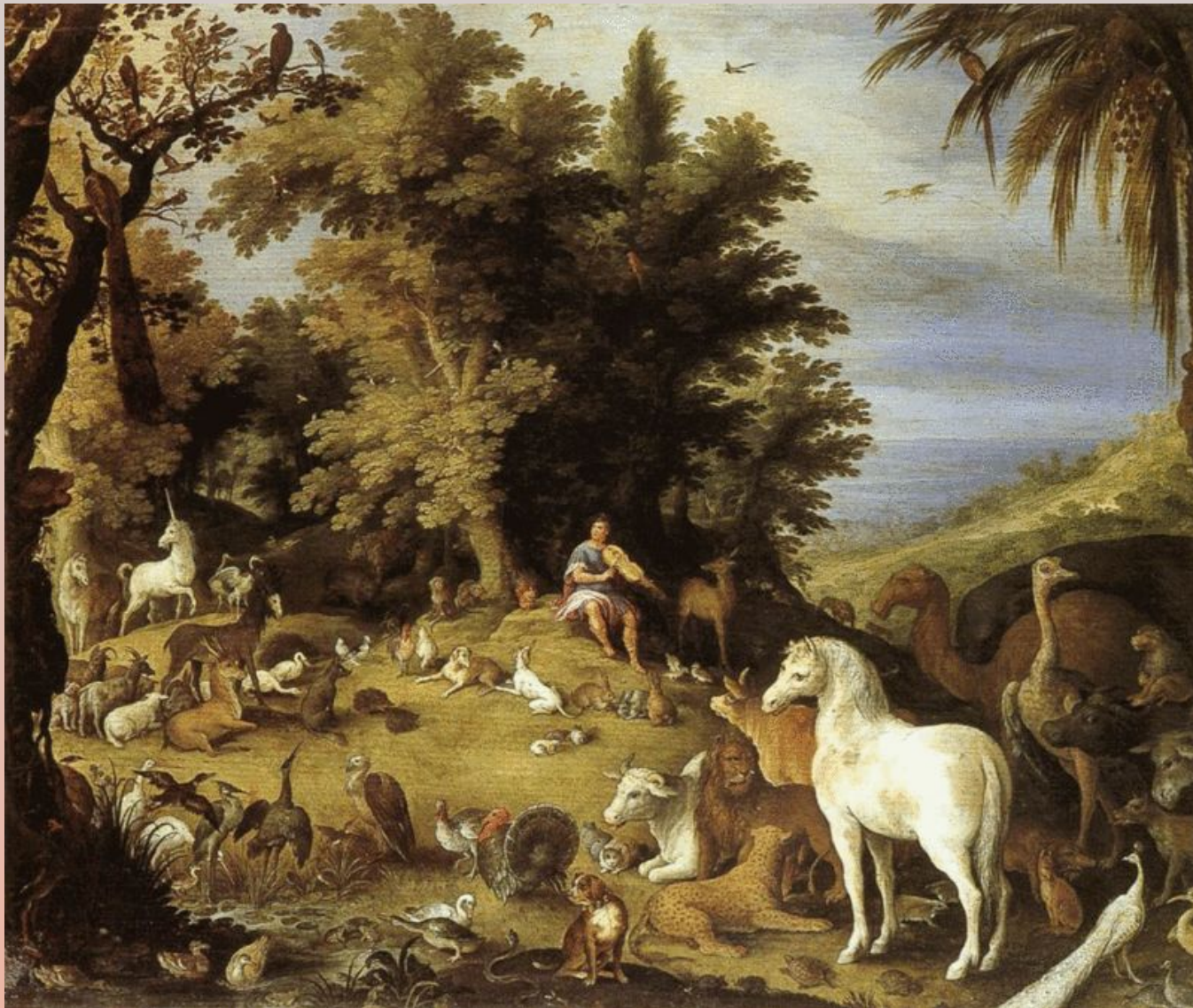
Картина Себастьяна Вранкса «Орфей и животные», 1595.