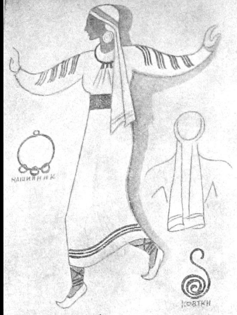
Святослав Гординський. Проект строю для старовинної ягідки, м. Львів, 1934 р.