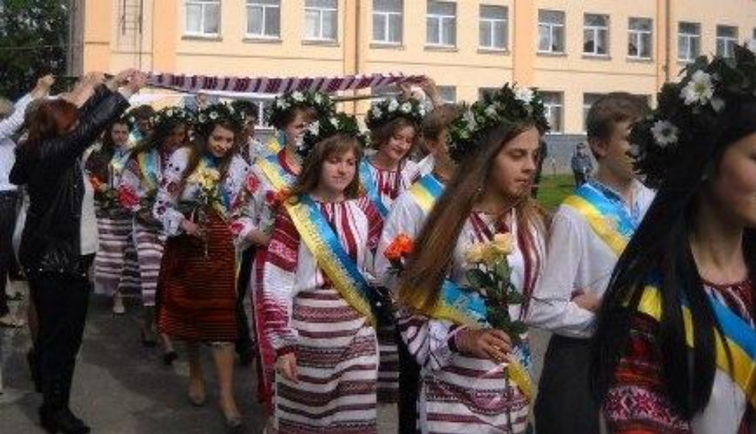
Дрес-код на шкільних святах. Свято Останнього Дзвоника у школі № 7 м. Львів, 2012 р.