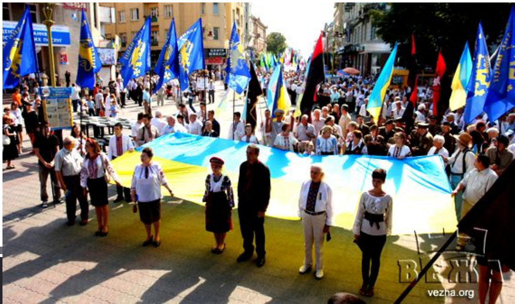
Марш у вишиванках (м. Івано- Франківськ. Святкування Дня Незалежності України. 2012 р.