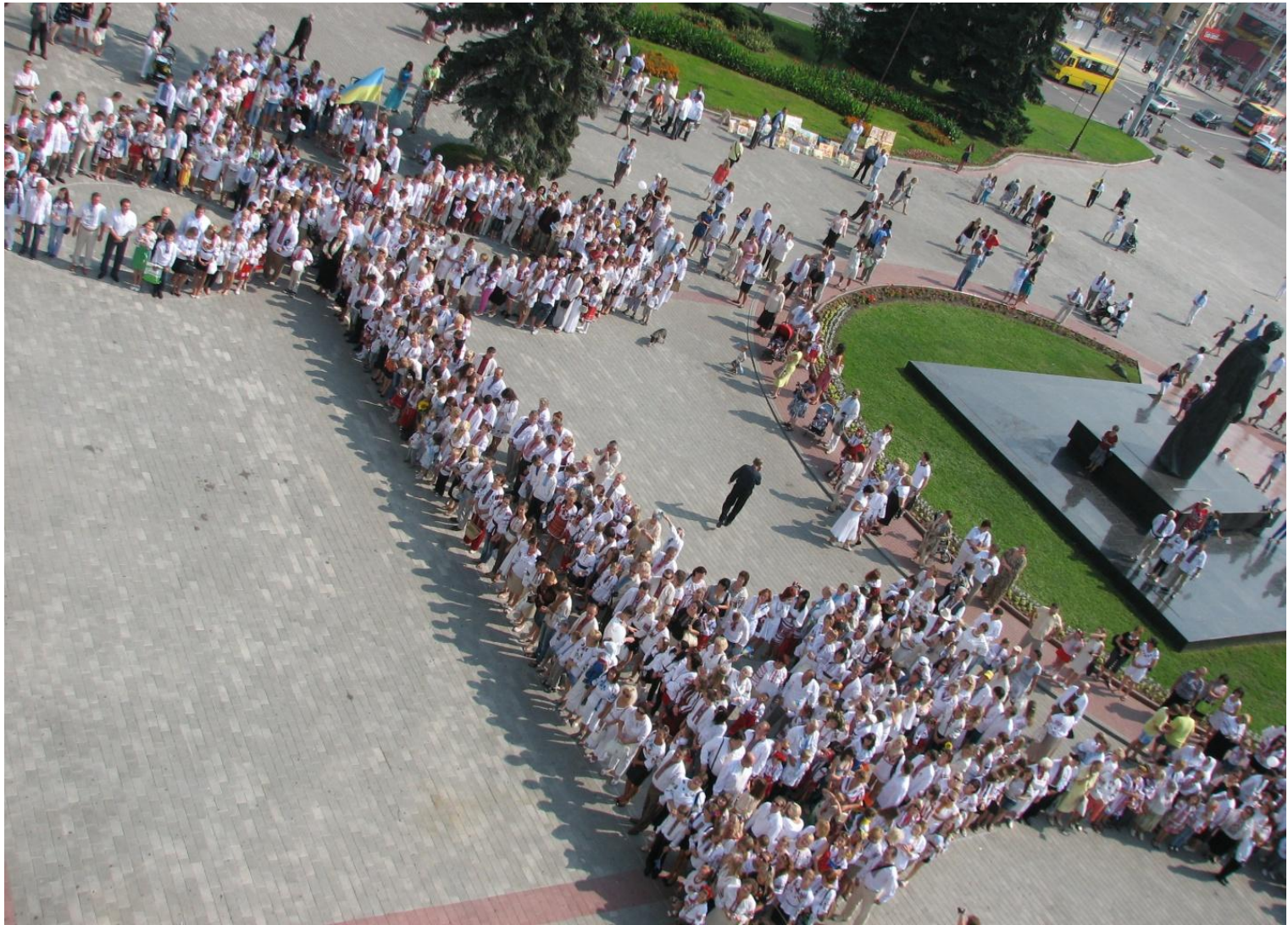
Флеш-моб у рамках святкування дня Незалежності України. м. Луцьк 2012