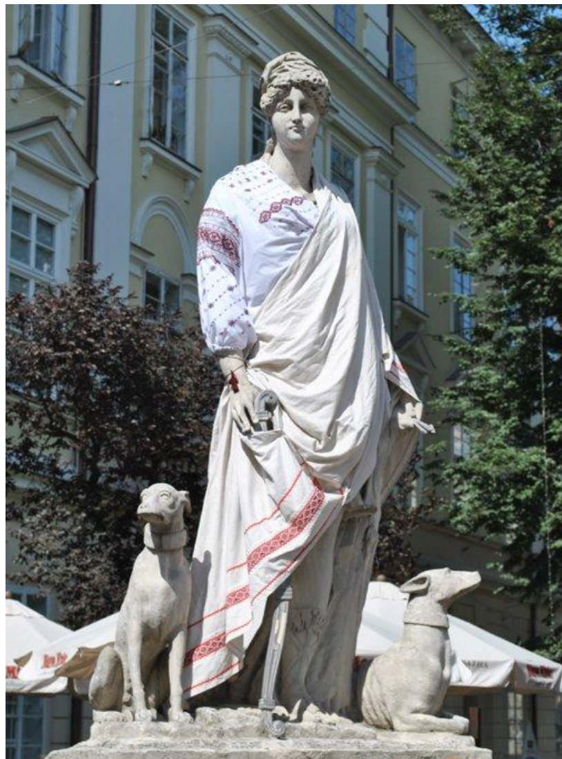
Скульптури-фонтани Нептуна, Діани, Адоніса та Амфїтрити у вишитому одязі. Львів, площа Ринок. 2007 р