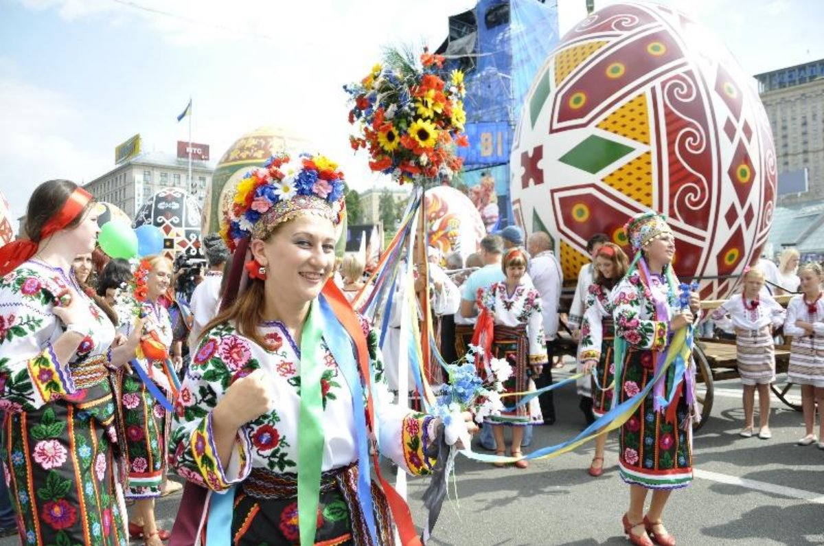
Чернівецька делегація — переможниця всеукраїнського «Параду вишиванок» у номінаціях «Найкраща чоловіча сорочка» та «Найкраща дитяча сорочка у м. Києві 2012».