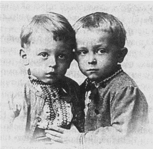
Вишите вбрання Андрія і Тараса Франко, м. Львів, 1891 р.