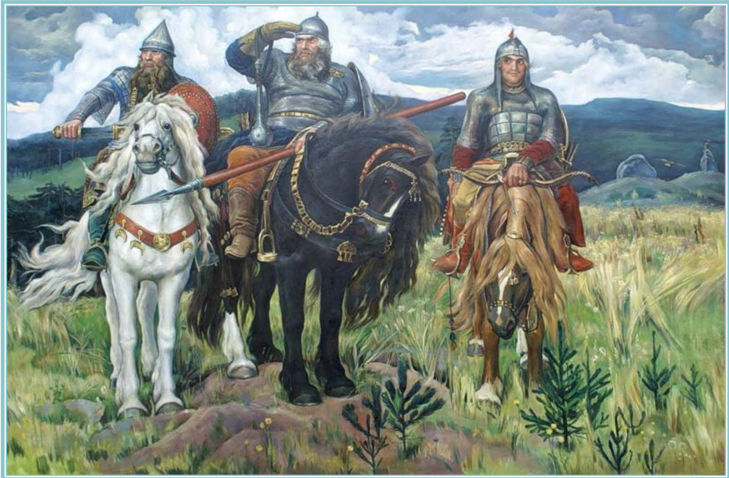
В.М. Васнецов « Богатыри »

На какой известной картине мы видим людей в доспехах?