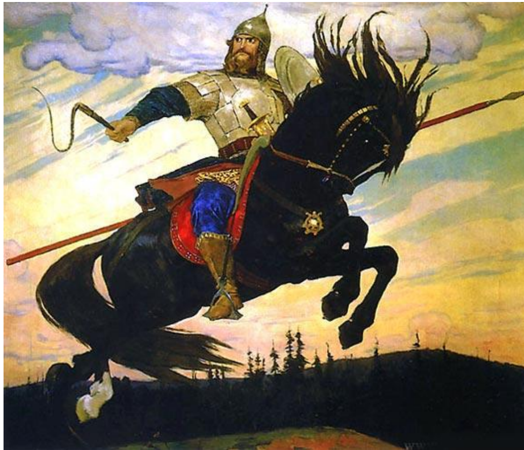
В. М. Васнецов. Богатырский скак

Крепкое телосложение, строгое лицо, длинные волосы, усы, борода.