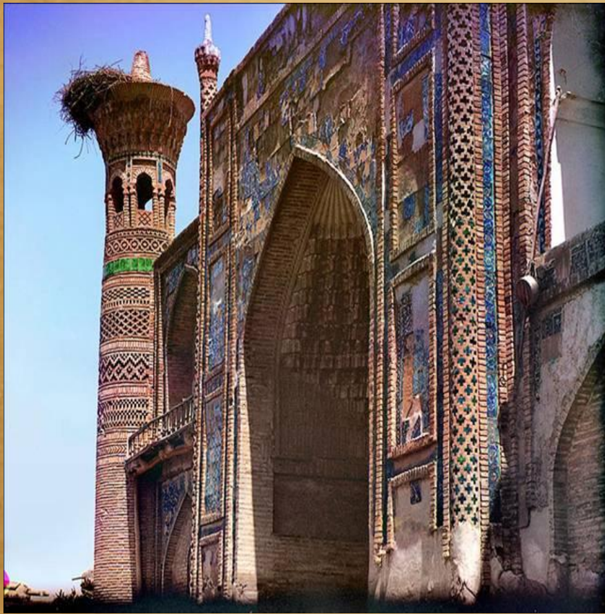
Медресе в Бухаре