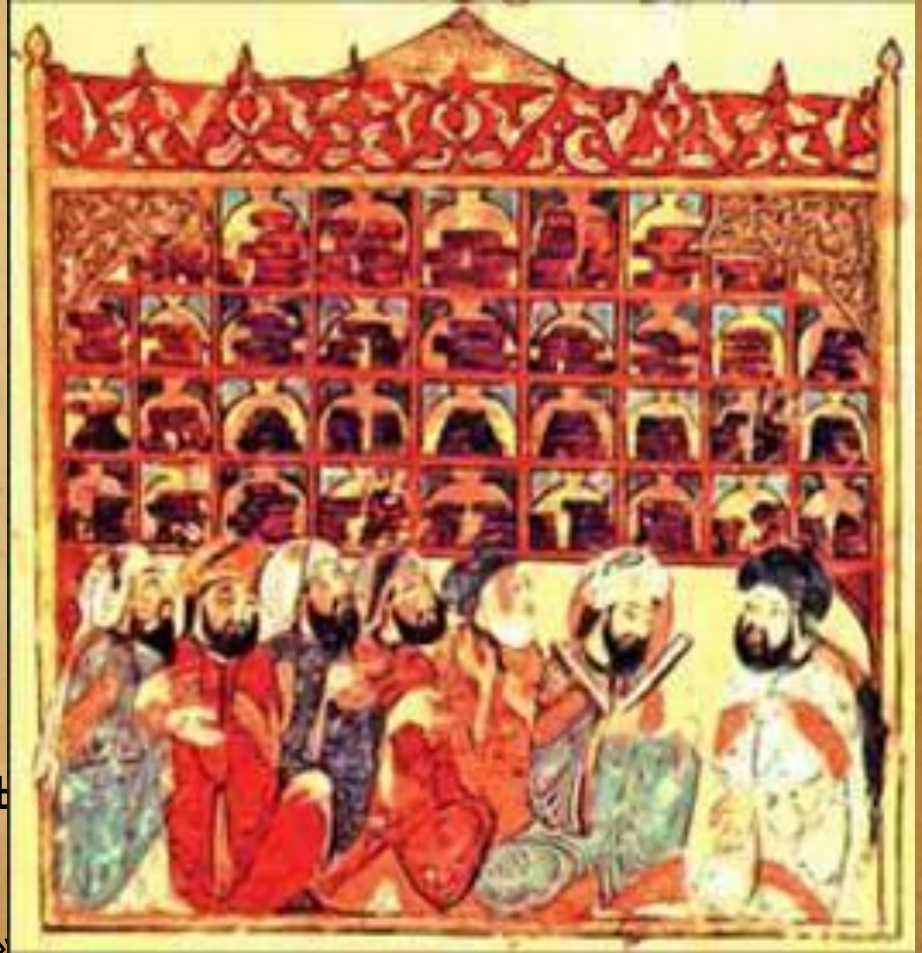
В багдадской библиотеке