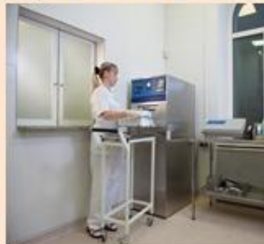
Стерилизация в автоклаве с регистрацией терморежимов