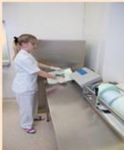
Индивидуальная упаковка каждого инструмента