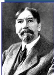
Торстен Веблен 1857-1929