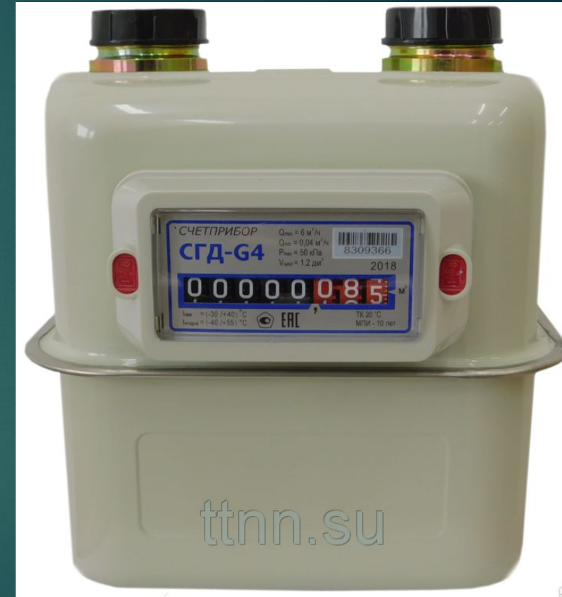
Счётчик Газа СГД-G4