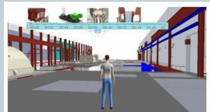
Рисунок 9. Виртуальный двойник обучаемого на площадке предприятия. В верхней части – шкала времени с отраженными на ней стадиями протекания аварии