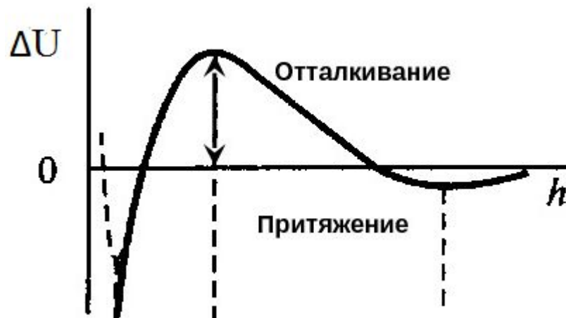
График зависимости энергии отталкивания ( \Delta U ) от расстояния между частицами выглядит следующим образом:

На очень малом и очень больном расстоянии \Delta U < 0 , и частицы притягиваются, но если они находятся на расстоянии примерно 10^{-5} м, то они будут отталкиваться.