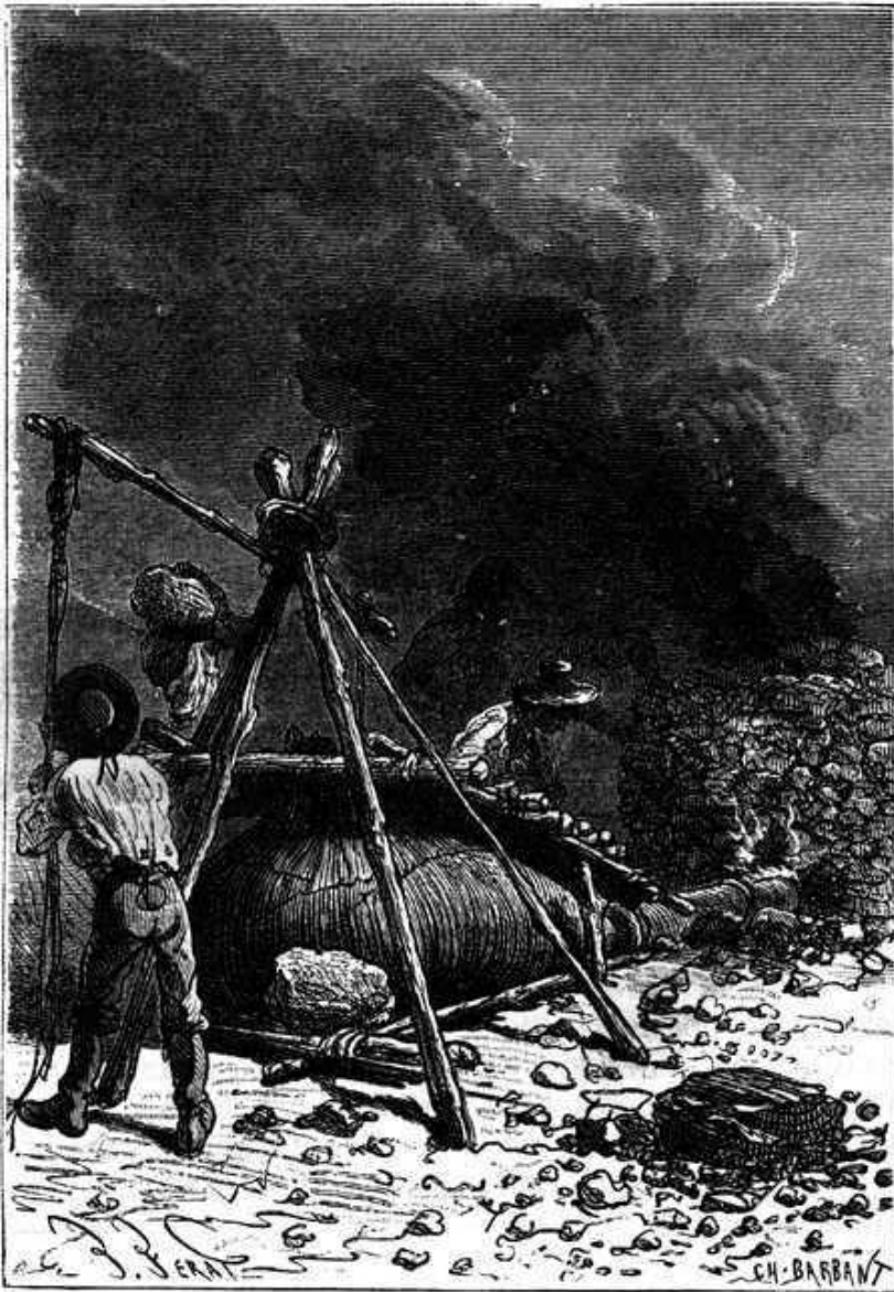
Работа была сложная.

«...Руду расколотили на мелкие куски и вручную очистили от комьев земли и от песка. Затем перемежающимися слоями насыпали большую грудку угля и руды, как складывают дрова угольщики, когда пережигают их на уголь. Под действием воздуха, нагнетаемого мехами, уголь в этой грудке превращается в двуокись, а затем в окись углерода, которая, действуя на окись железа, отнимала от неё кислород. Сайрес Смит сделал для этого всё, что следовало. Возле насыпной кучи руды и угля установили мехи, сшитые из тюленьих шкур; воздух выходил из мехов через трубку, сделанную из огнеупорной глины, - трубку эту специально изготовили и обожгли в