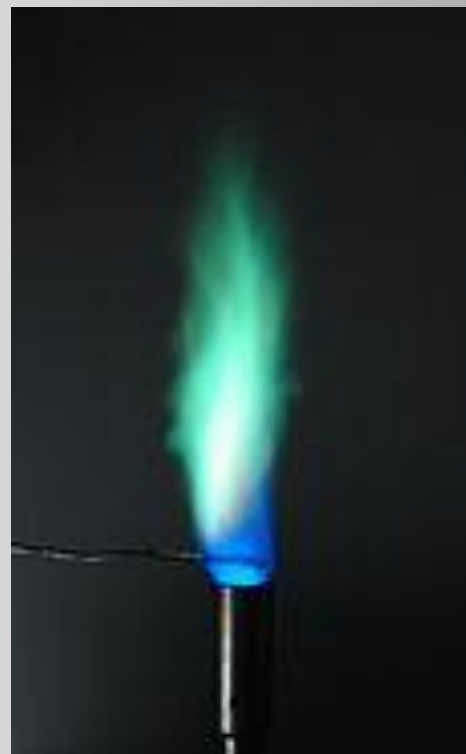
Мыс иондары отты жасыл туске айналдырады