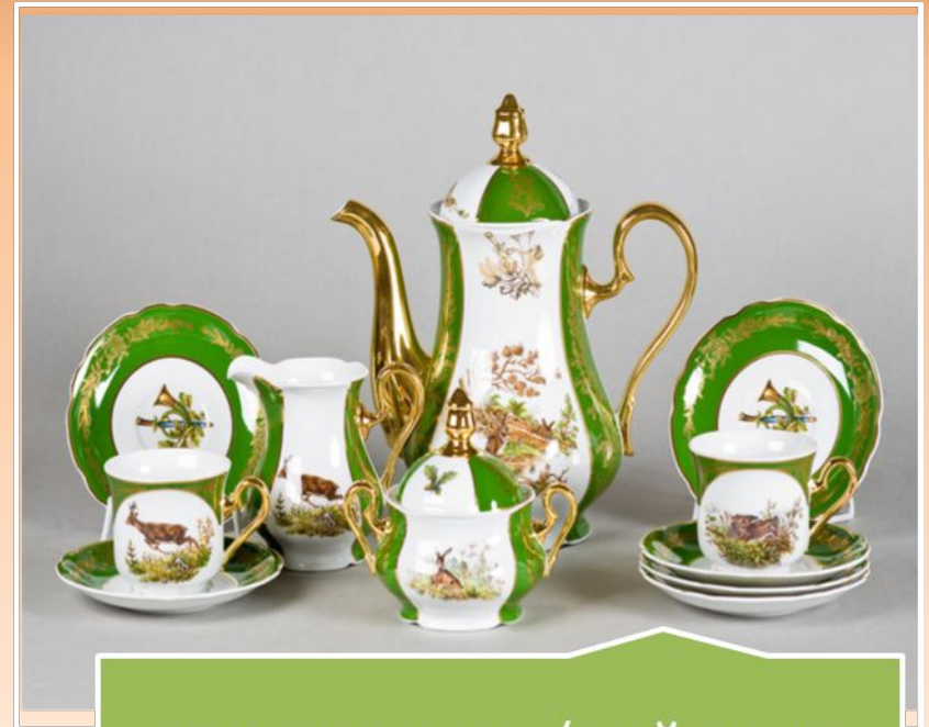
глазурованная (майолика, фаянс, фарфор, шамот)