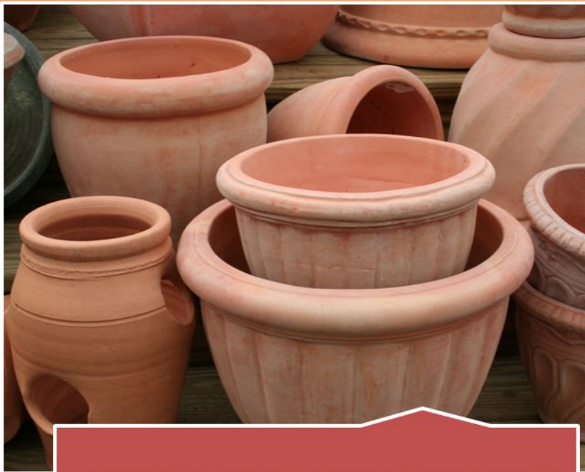
неглазурованная керамика (терракота и гончарная)