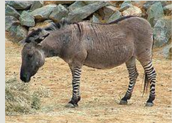
Гибрид зебры и домашнего осла