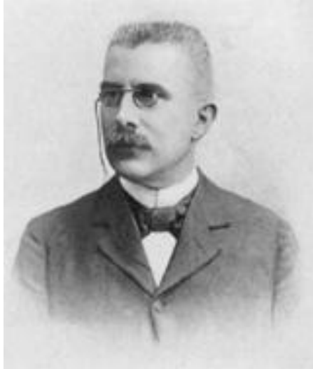
Анри Луи Ле-Шателье